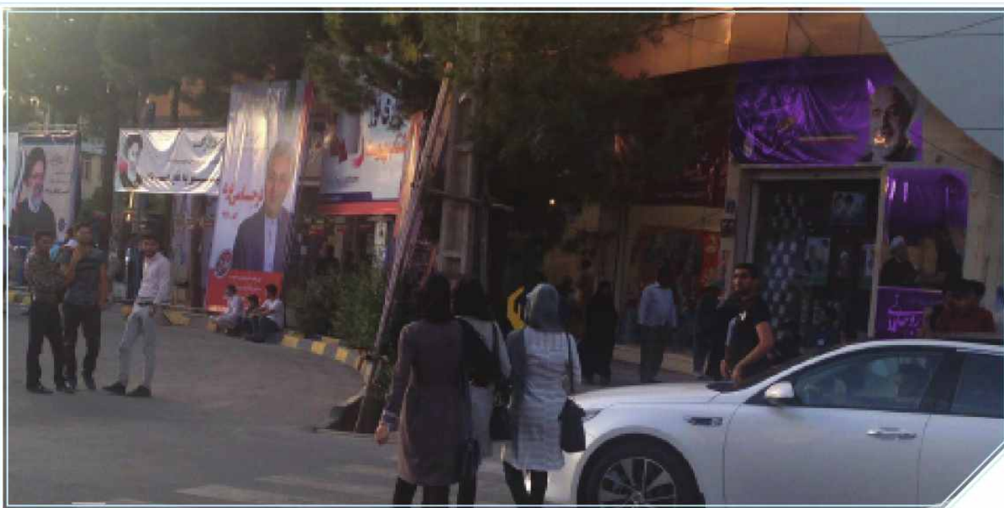
مطالبات شمال شهر نشین ها از کاندیداهای شورا