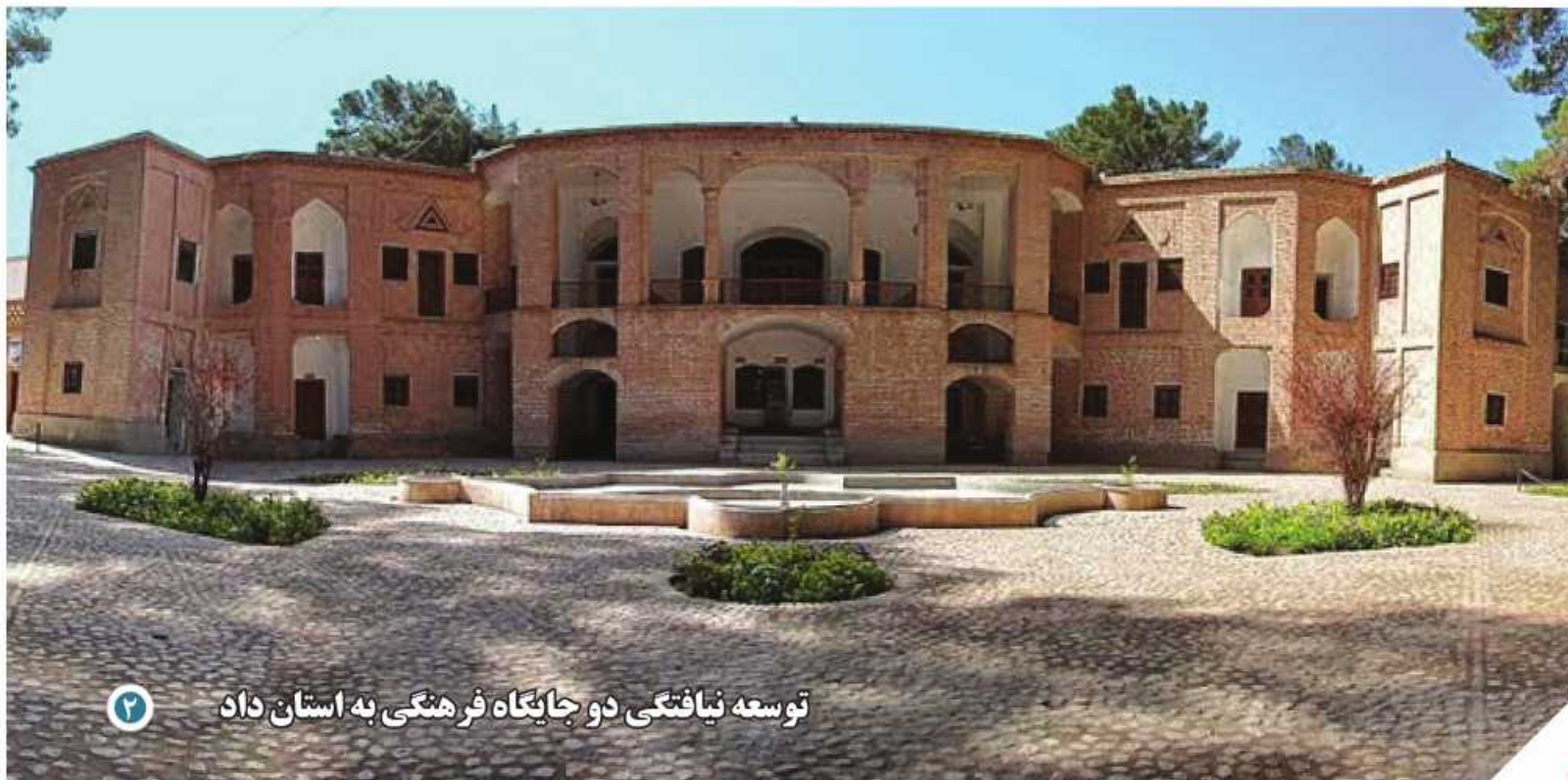
توسعه نیافتگی دو جایگاه فرهنگی به استان داد