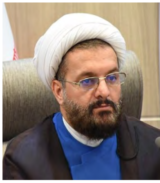
مبلغی را می کردند که این موضوع یک کلاهبرداری بود و امیدواریم در انتخابات جاری مردم فریب این کلاهبرداری ها را نخورند.

تمام تلاش و همت ما این است که بتوانند هوشمندانه با حضور حداکثری خود مشارکت بالایی را رقم بزنند. انتخابات شورای شهر و روستا و حتی ریاست جمهوری در استان نشویم. معاون اجتماعی و پیشگیری از وقوع جرم دادگستری خراسان جنوبی با اشاره به تشکیل شعب رسیدگی به تخلفات ادامه داد: متأسفانه در شرایطی که هنوز اسامی تأیید صلاحیت شده ها اعلام نشده برخی از افراد اقدام به تبلیغات در فضای مجازی می کنند که این مهم توسط پلیس فتای استان پیگیری می شود. وی با اشاره به تدوین منشور اخلاقی انتخابات در خراسان جنوبی گفت: نامزد های انتخاباتی و طرفداران آن ها باید