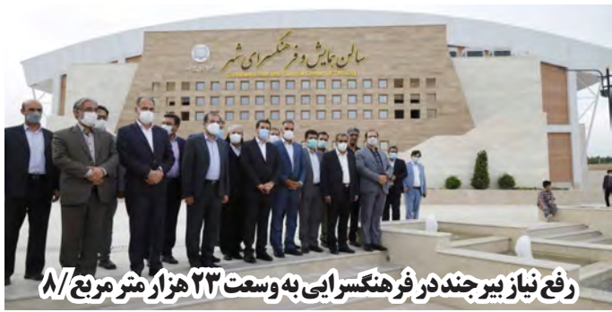
رفع نیاز بیرجند در فرهنگسرای به وسعت ۲۳ هزار متر مربع / ۸

انتقاد نمایندگان کارگران از قرارداد های سفید امضای کارگری