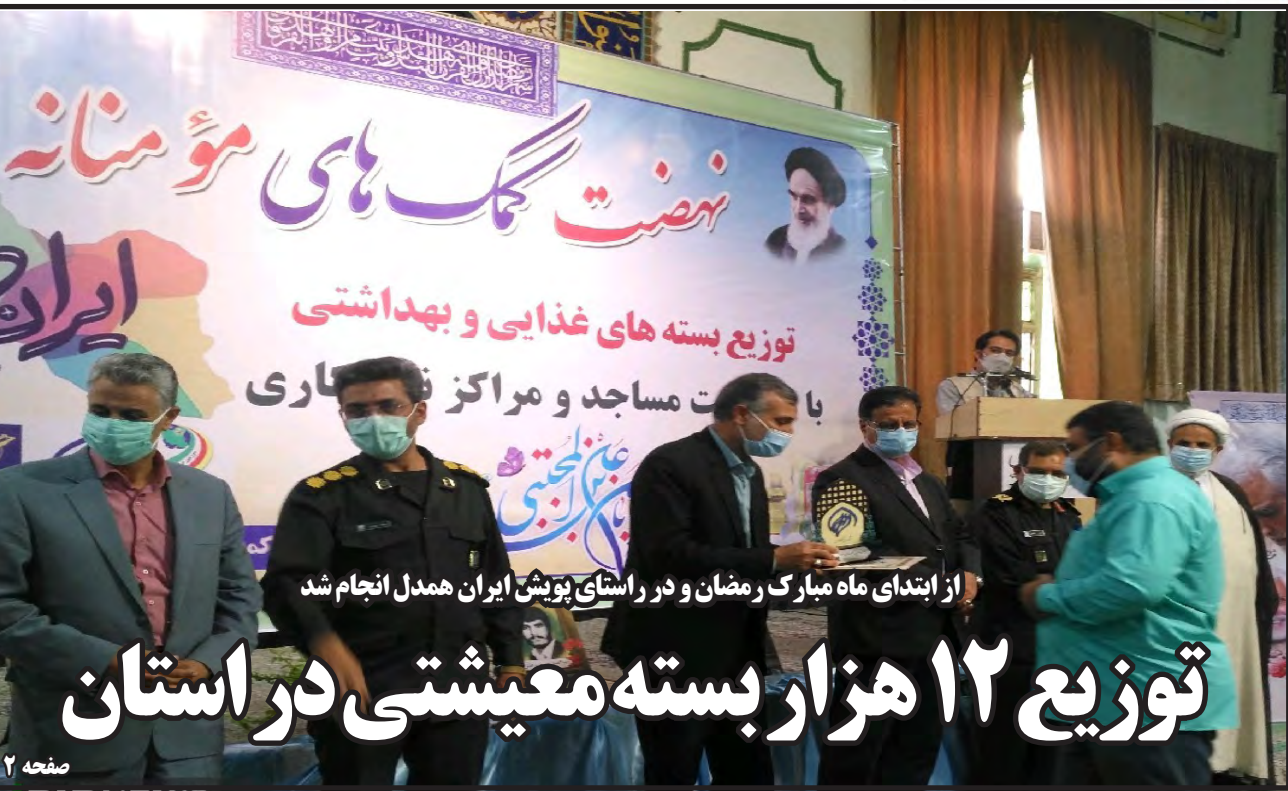
از ابتدای ماه مبارک رمضان و در راستای پوشش ایران همدل انجام شد

عدم حمایت استان از حوزه درمان تامین اجتماعی / ۵