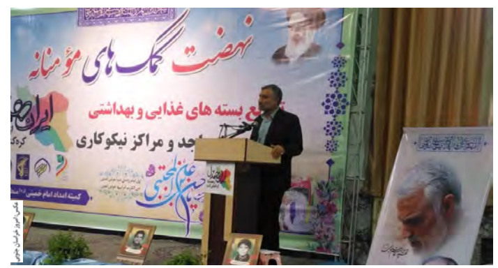
مدیرکل کمیته امداد خراسان جنوبی در زمانیکه کمک مومنانه (ایران همدل) گفت: از ابتدای ماه مبارک رمضان تاکنون ۱۲۰۴۹ بسته معیشتی به ارزش ۲ میلیارد و ۸۶۴ میلیون تومان در بین خانوارهای نیازمند با همراهی خیرین توزیع شده است.