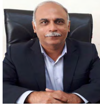
مدیرکل انتقال خون در میدان پاسداران شهر بیرجند و میدان امام شهر طبس فعال است.