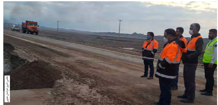
سیلاب در ۳ روز گذشته به ۶۲۰ کیلومتر از راه های اصلی، فرعی و روستایی خسارت وارد کرد و راهداران برای برقراری ارتباط ایمن روستاهای درگیر سیلاب در تلاشند. مدیرکل راهداری و حمل و نقل جاده ای خراسان جنوبی گفت: با توجه به مخاطرات جدی ایجاد شده بواسطه سیلاب در ۳ روز گذشته، تعداد ۶۰ تیم عملیاتی با فعال سازی قرارگاه استانی حمل و نقل و راهداری زمستانی، برنامه ریزی و تعداد ۲۰۰ نفر راهدار یا ۳۰۰ دستگاه انواع ماشین آلات راهداری سبک و سنگین بصورت شبانه روزی جهت عملیات بازگشایی محورهای روستایی بکارگیری شدند.