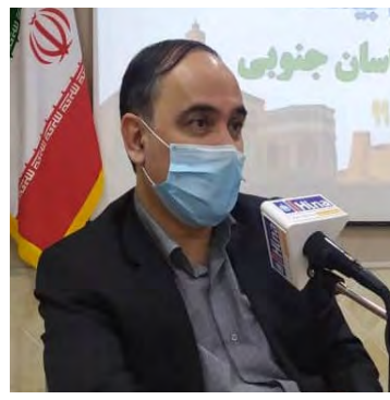
اداره کل میراث فرهنگی، گردشگری و صنایع دستی خراسان جنوبی