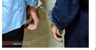
داماد متخلف در طبس بازداشت شد

داماد طبسی به علت سلب آسایش در مراسم عروسی و اعتراض شهروندان دستگیر شد. به گزارش خبرگزاری صدا و سیما مرکز خراسان جنوبی؛ بازپرس دادگستری شهرستان طبس از بازداشت داماد و خاطیان مراسم عروسی خبر داد. ابراهیمی گفت: در پی اخبار واصله و گزارشات متعدد مردمی مبنی بر ایجاد هیاهو و جنجال و حرکات غیرمتعارف در ساعات پایانی شب بلافاصله مأموران انتظامی شهرستان وارد عمل شده و ضمن اخطار قانونی و پرهیز از هرگونه ایجاد سر و صدا و بی نظمی سعی در متفرق کردن افراد دخیل کرده و متاسفانه علی رغم تذکرات متعدد، شرکت کنندگان در کارناوال عروسی توجهی به اظهارهای انجام شده، نکرده و همچنان بر اقدامات خلاف قانون خود اصرار کردند و ضمن عدم رعایت پروتکل های بهداشتی و عدم تمکین به مصوبات ستاد کرونا شهرستان با ایجاد تجمع، بهداشت عمومی جامعه را به مخاطره انداخته اند، سپس فوراً نسبت به شناسایی و تعقیب تمام افراد دخیل در موضوع اقدام و پس از صدور دستور بازپرس کشیک دادرسی عمومی و انقلاب طبس نسبت به دستگیری و بازداشت تمام مجرمان و بخصوص برگزار کنندگان این مراسم اقدام شد.