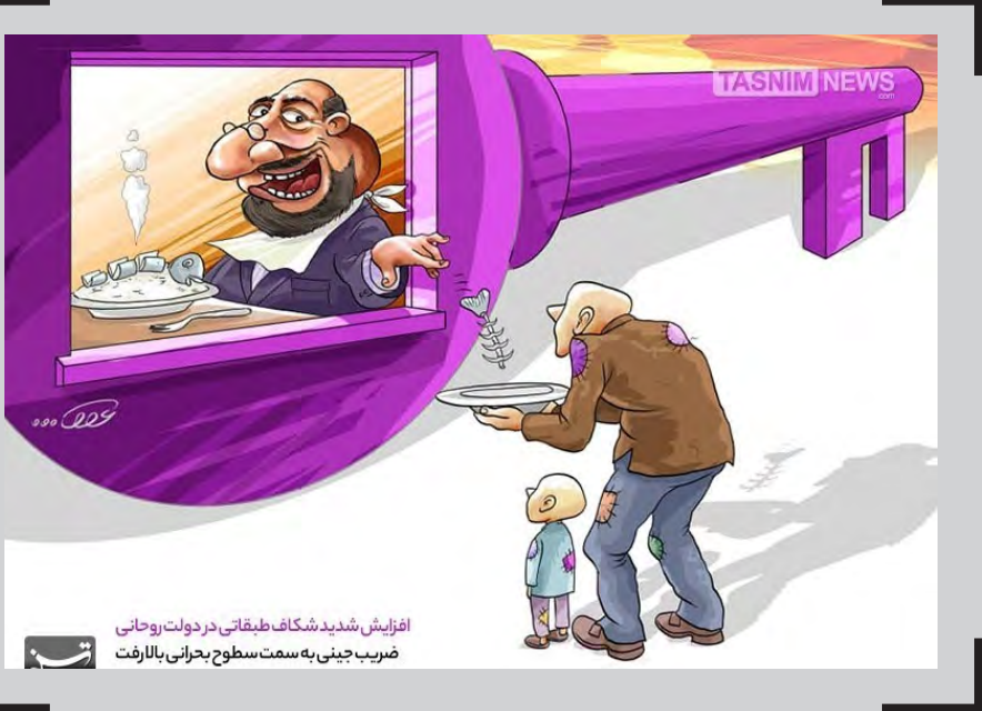
افزایش شدید شکاف طبقاتی در دولت روحانی ضرب جینی به سمت سطوح بحرانی بالارفت