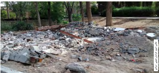
پس از تخریب ساختمان راهنمایی و رانندگی

برخوردی با مورد اجاره داشته باشد از بقیه دستگاه ها چه انتظاری می‌توان داشت. وی با اشاره به اینکه شنیده‌ام راهنمایی و رانندگی از شهرداری خواسته است تا محل دیگری برای استقرار راهنمایی و رانندگی آماده و تجهیز کند. گفت: در هیچ کجای قوانین جمهوری اسلامی وظیفه ای برای شهرداری به منظور تأمین ساختمان راهنمایی و رانندگی تعریف نشده است و اگر تاکنون هم راهنمایی و رانندگی در ساختمان متعلق به شهرداری ساکن بوده در جهت همکاری و تعامل بوده است.