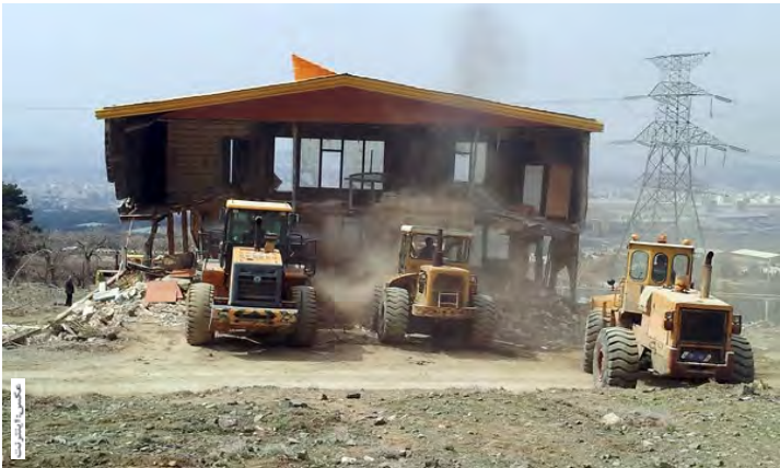
فرهادی در کارگروه ویژه پیشگیری و برخورد مؤثر فوری با تخلفات ساخت وساز استان اظهار کرد: با عنایت به مشکلات موجود در برخورد قانونی با تخلفات و عدم وجود ساز و کارها و اهرم های قانونی مشخص در برخی امور، کلیه مراجع ذیربط بویژه صدور پروانه باید بطور مستمر پیگیری اصلاح ضوابط و قوانین مرتبط باشند.

فرهادی بر تشکیل جلسات کارگروه به ویژه در حوزه شهرستانی به صورت مستمر تأکید کرد. شایان ذکر است این جلسه با حضور معاون دادستان استان، فرماندهی انتظامی استان، مدیران دستگاه های اجرایی و حضور ویدئو کنفرانسی فرمانداران برگزار شد.