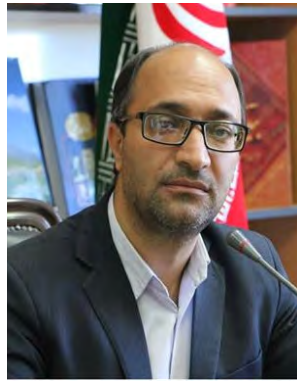
معاونت امور فرهنگی وزارت فرهنگ و ارشاد اسلامی به منظور رونق بخشیدن به بازار کتاب و ترویج کتابخوانی و حمایت از کتابفروشی ها برگزار می شود. رضوانی یادآور شد: در این طرح تسهیلاتی در قالب یارانه خرید کتاب از طریق کتابفروشی های سراسر کشور، مستقیماً به خریداران کتاب پرداخت می شود که میزان یارانه برای کتاب ها ۲۰ درصد و سقف مجاز خرید برای هر خریدار حداکثر ۲۰۰ هزار تومان اعلام شده است.

از ۱۷ خرداد به مدت یک هفته در سراسر کشور برگزار می شود. وی خاطرنشان کرد: کتاب فروشی های مشارکت کننده در طرح های قبلی، برای تأیید شرکت در بهارانه کتاب ۱۴۰۰ نیاز به ثبت نام مجدد ندارند و کافی است با مراجعه به پنل کاربری خود شرایط شرکت در طرح را تأیید و اطلاعات خود را کنترل و ویرایش کنند. به گفته وی طرح بهارانه کتاب توسط خانه کتاب و ادبیات ایران با حمایت