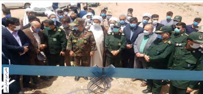
بالم بر ۱۲۵ میلیارد ریال هزینه شده است که سهم بسیج سازندگی ۴۵ میلیارد

به گزارش امروز خراسان جنوبی، مسئول سازمان بسیج سازندگی خراسان جنوبی در این آیین اظهار کرد: برای اجرای ۷۳ پروژه عمرانی و محرومیت زدایی اعتباری