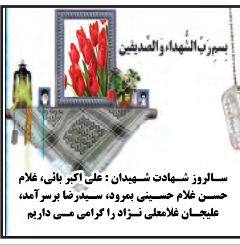
بسم رب الشهداء و الصدیقین