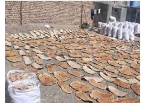
مراجعه ذیصلاح ارسال شد.

معاون بازرسی و حمایت از مصرف کنندگان سازمان صنعت، معدن و تجارت خراسان جنوبی بیان کرد: این پرونده تخلف برای سیر مراحل قانونی به مراجع ذیصلاح ارسال شد. وی با هشدار به سودجویان تأکید کرد: با هرگونه تخلف در حوزه آرد و نان براساس ضوابط و قانون به شدت برخورد می شود.