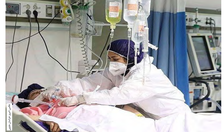
در بیمارستان های خراسان جنوبی بستری هستند که ۸۲ نفر کرونا مثبتند.

نفر نامساعد است. وی افزود: طی روز گذشته ۳۴ بیمار با علائم تنفسی در بیمارستان های استان پذیرش شدند که در همین مدت ۴۴ بیمار شامل ۱۵ بیمار ترخیص شدند. معاون بهداشتی دانشگاه علوم پزشکی بیرجند گفت: تاکنون ۲۰ هزار و ۵ بیمار مبتلا به کرونا بهبود یافته و یا در قرنطینه خانگی بسر می برند. وی گفت: همچنین در روز گذشته هزار و ۱۹۳ نفر در استان واکسن نوبت اول دریافت کردند که به این ترتیب مجموع افرادی که واکسن نوبت اول دریافت کردند به ۳۸ هزار و ۸۱۰ نفر رسید. مهدی زاده افزود: در روز گذشته همچنین ۳۹ نفر واکسن نوبت دوم را دریافت کردند که به این ترتیب مجموع افرادی که واکسن نوبت دوم را دریافت کردند به ۳ هزار و ۶۹۵ نفر رسید.