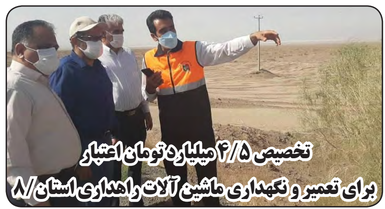
تخصیص ۲/۵ میلیارد تومان اعتبار برای تعمیر و نگهداری ماشین آلات و هنداری استان صفحه ۸