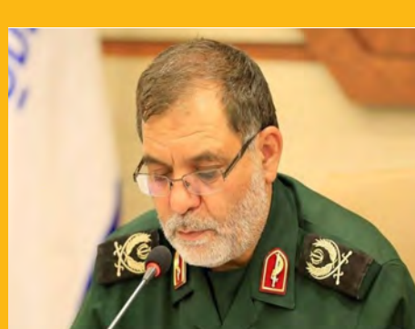
شعارهای نامزدهای انتخابات عملیاتی و قابل دسترسی باشد صفحه ۴

واکسیناسیون ۷۰ نفر از بیرجندی ها در منزل صفحه ۲