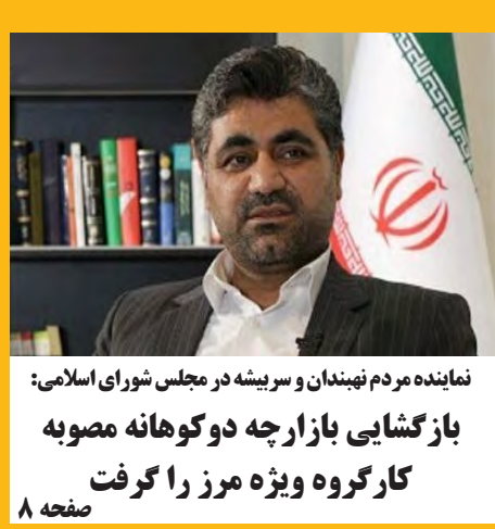
نماینده مردم نهبندان و سریشه در مجلس شورای اسلامی: بازگشایی بازارچه دوکوهانه مصوبه کارگروه ویژه مرز را گرفت صفحه ۸

ارزش کالاهای صادراتی استان ۳۰ درصد افزایش یافت صفحه ۵