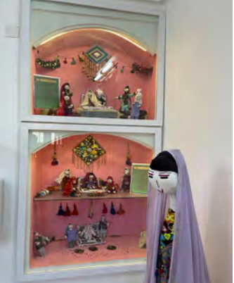
تعدادی از عروسکها در فهرست میراث ملی ثبت شده است.