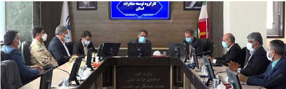
وزارت کشور - استانداری خراسان جنوبی - صادرات همکاران غیر ایرانی

خراسان جنوبی سهم بسزایی در صادرات به کشور افغانستان دارد و از لحاظ وزن حدود ۴۸ درصد صادرات به این کشور از خراسان جنوبی انجام می شود.