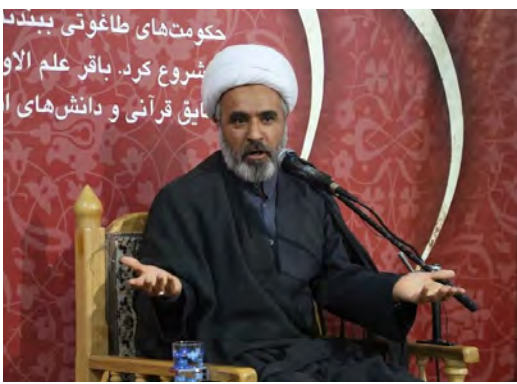
حکومت‌های طاغوتی بیداد شروع کرد. باقر علم الاویق قرآنی و دانش‌های ا

رئیس ستاد تبلیغاتی آیت... رئیسی در خراسان جنوبی: