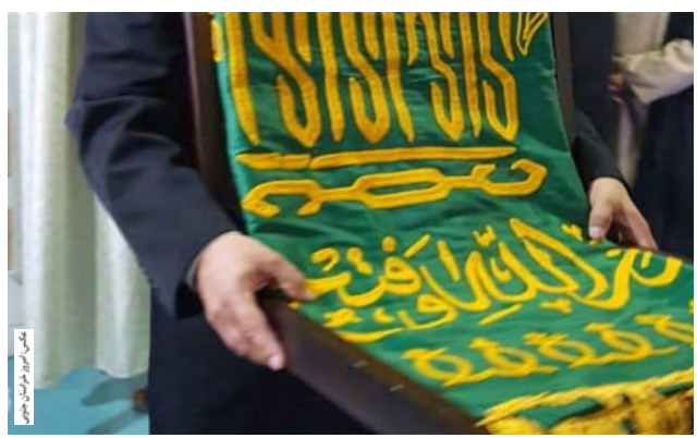
(ع) و رضایت خانواده مقتول که از طرف خدام حضرت حاصل شد، زندانی "م ک" که بارها ابراز ندامت و پشیمانی کرده بود دیدن پرچم سبز حرم رضوی منقلب شده

بود در ادامه حاضر به رضایت برای قاتل "ع ک" نشد و بیان کرد این بخشش به رفتارهای آینده خود قاتل و ابراز پشیمانی وی بستگی دارد که تاکنون حتی نه تنها یک بار ابراز پشیمانی نکرده بلکه تهدید و حرکات خلاف شرع انجام داده است. خدام حرم رضوی که بدون اطلاع قبلی با دختر مقتول دیدار کردند از وی بابت بخشش یکی از زندانیان تشکر کردند و ابراز امیدواری کردند تا دیگر زندانی نیز پشیمان شده و جبران کننده کارهای گذشته خود باشد. گفتنی است این حادثه تلخ به صورت طایفه ای در استان دیگری رخ داده و قاتل و مقتول با هم فامیل بودند و هم اکنون زندانیان در زندان زاهدان هستند.