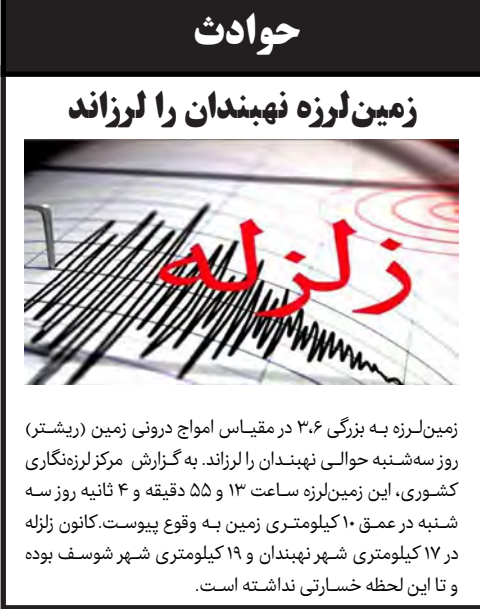
زمین لرزه نهیبندان را لرزاند

زمین لرزه به بزرگی ۳.۶ در مقیاس امواج درونی زمین (ریشرتر) روز سه شنبه حوالی نهبندان را لرزاند. به گزارش مرکز لرزهنگاری کشوری، این زمین لرزه ساعت ۱۳ و ۵۵ دقیقه و ۴ ثانیه روز سه شنبه در عمق ۱۰ کیلومتری زمین به وقوع پیوست. کانون زلزله در ۱۷ کیلومتری شهر نهبندان و ۱۹ کیلومتری شهر شوسف بوده و تا این لحظه خسارتی نداشته است.