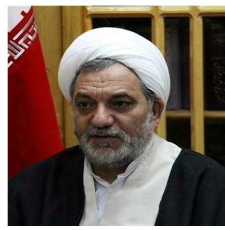
رئیس کل دادگستری خراسان جنوبی با بیان اینکه مبارزه با عوامل و ریشه های فساد باید در اولویت پیگیری و برخورد قضایی باشد، گفت: در سه ماه نخست امسال ۸ هزار و ۷۰۰ دادگاه آنلاین در استان برگزار شد که در این رابطه

استان رتبه نخست کشور را دارد. به گزارش تسنیم، حجت الاسلام ابراهیم حمیدی در مراسم تکریم و معارفه روسای حوزه های قضایی شهرستان های قاین، فردوس، سرایان و خوسف و دادستان خوسف اظهار داشت: نباید در قوه قضائیه منفعل باشیم و باید از همه ظرفیت ها و امکانات قوه قضائیه برای حل مشکلات استفاده حداکثری کرد. وی افزود: باید با استفاده از امکانات قوه قضائیه به دنبال جرم زدایی از جامعه باشیم و مبارزه با عوامل و ریشه های فساد باید در اولویت پیگیری و برخورد قضایی باشد. رئیس کل دادگستری خراسان جنوبی از برگزاری دادگاه های آنلاین در استان خبر داد و گفت: در سه ماه اول امسال ۸ هزار و ۷۰۰ دادگاه آنلاین در خراسان جنوبی برگزار شد که خراسان جنوبی در برگزاری دادگاه های آنلاین رتبه اول کشور را دارد. حجت الاسلام و المسلمین حمیدی با تأکید بر اینکه مسئولان قوه قضائیه باید انقلابی باشند تا تحول در طراز انقلاب را شاهد باشیم، گفت: دادستان ها باید مواجه ایجابی و فعال داشته باشند که به استقبال مشکلات و