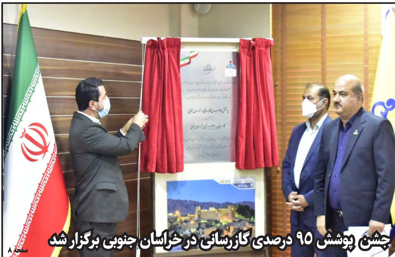
چشم پوشش ۹۵ درصدی گازرسانی در خراسان جنوبی برگزار شد