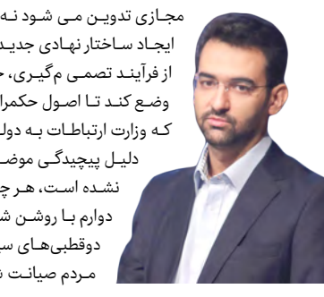
محمدجواد آذری جهرمی

محمدجواد آذری جهرمی وزیر ارتباطات و فناوری اطلاعات گفت: اصل ورود مجلس به قانونگذاری در مورد حکمرانی سایبری، به شرط رعایت برخی اصول، مبارک است. کشوری که قاعده های شفاف در فضای مجازی ندارد، در عمل با رهاشدگی این فضا مواجه است. باید توجه داشت که اصول حکمرانی سایبری در کشورها اساسا برای بهره گیری از فضای مجازی تدوین می شود نه برای انسداد. بر اساس طرح مجلس که به دست ما رسیده است، ایجاد ساختار نهادی جدید و واگذاری اختیارات قانونگذار به این نهاد و همچنین حذف دولت از فرآیند تصمی م گیری، حکمرانی سایبری ایران را مهم تر می کند. اگر مجلس قواعد روشنی وضع کند تا اصول حکمرانی ایران در آن به وضوح دیده شود، بسیار مفید است. ۵ لایحه ای که وزارت ارتباطات به دولت داد، اقدامی کلیدی برای تبیین حکمرانی سایبری کشور بود. به دلیل پیچیدگی موضوع، هنوز این ۵ لایحه در دولت جمع بندی نشده و به مجلس ارسال نشده است، هر چند ما مجلس را در جریان جزئیات این ۵ لایحه قرار داده ایم. امی دوارم با روشن شدن ابعاد موضوع و اهمی ت آن، بررسی این مهم در مجلس از گزند دو قطبی های سیاسی در امان بماند و با تصویب یک قانون پیشرو، حقوق اساسی مردم صیانت شده و رشد و پیشرفت ایران در فضای مجازی نیز تسهیل شود.