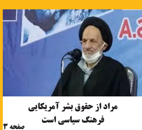
مراد از حقوق بشر آمریکایی فرهنگ سیاسی است