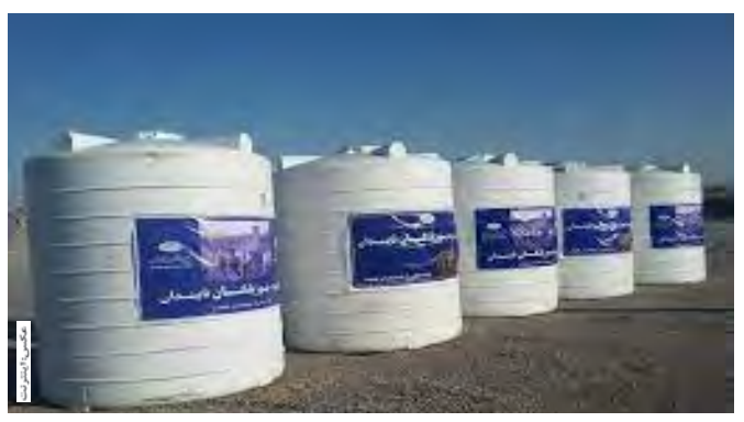
راکارهای حفاظتی این موضوع مرتفع می شود. وی تأمین آب حیات وحش را یکی از ضروریات دانست و گفت: در برخی نقاط نصب تانکر با کمک خیران، بدلیل تراکم حیات وحش و دوری آن ها از چشمه های طبیعی و منابع آبی ثابت و از طرفی خشکیدن برخی چشمه ها بدلیل وقوع خشکسالی های چندین ساله می تواند به این قضیه کمک شایانی کند و در برخی نقاط مانع از ورود حیات وحش به قنوات و چشمه های روستائیان شود. کارشناس مسئول نظارت بر امور حیات وحش محیط زیست استان با بیان