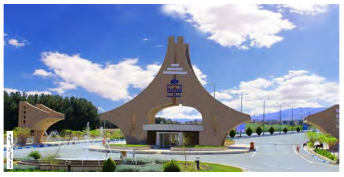
همچنین مدت اعطای بورسیه تحصیلی در همه سطوح تعریف شده بورسیه، برای مقطع کارشناسی ارشد و ۴ و نیم سال و نیمسال تحصیلی لحاظ می شود.

همکاری های علمی بین المللی گفت: سطوح بورسیه شامل بورسیه استاد دکترا، غلامحسین شکوهی (شهریه دانشگاه، هزینه اسکان در خوابگاه و هزینه تغذیه حذف شده و علاوه بر آن مبلغی تحت عنوان کمک هزینه تحصیلی بصورت سالیانه پرداخت می شود) و بورسیه نوع الف (شهریه دانشگاه، هزینه اسکان در خوابگاه و هزینه تغذیه حذف می شود) و بورسیه نوع ب (تا سقف ۵۰ درصد از شهریه دانشگاه، هزینه اسکان در خوابگاه و هزینه تغذیه به تشخیص شورای تحصیلات تکمیلی و تأیید ریاست دانشگاه بخشوده می شود) است.