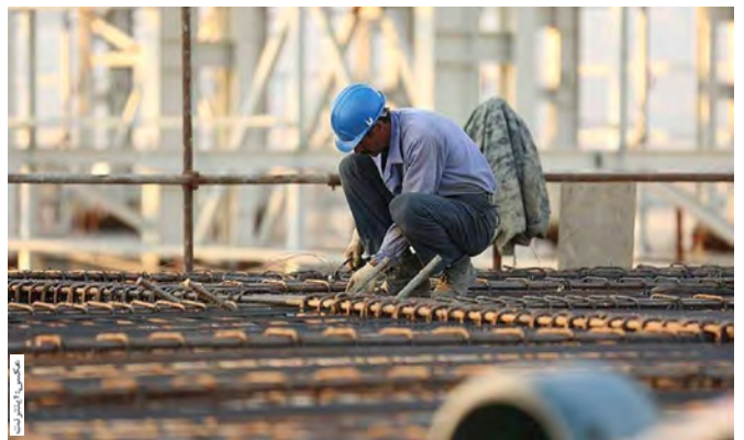
مدیرکل تعاون، کار و رفاه اجتماعی خراسان جنوبی گفت: از ابتدای سال جاری جاری تاکنون با انجام اقدامات حمایتی از واحدهای تولیدی و کارگران، واحدهای دارای حقوق معوق ۲۰ درصد و معوقات کارگری نیز ۱۴ درصد در استان کاهش یافته است.

می شوند، اظهار داشت: از ابتدای سال جاری تاکنون ۱۱۴ مقرری بگیری از طریق واحدهای متقاضی نیروی کار و یا خود اشتغالی مشغول به کار شدند. وی ادامه داد: در سه ماه گذشته مقرری بیمه بیکاری افراد ۴۸ نفر از طریق کشف اشتغال پنهان، عدم قبول شغل پیشنهادی و سایر قطع شده است. اشرفی در خصوص وظایف و رسالت های اداره کل تعاون، کار و رفاه اجتماعی در خصوص حمایت از مشاغل تصریح کرد: در سه ماه گذشته ۱۹ بنگاه اقتصادی مشکل دار با هزار و ۲۸۰ کارگر در استان شناسایی شد. وی افزود: در همین فرصت با همکاری سایر دستگاه های مربوطه و کارفرمایان واحدها، از هزار و ۱۱۶ کارگر واحدهای مشکل دار استان حمایت های لازم صورت پذیرفت.