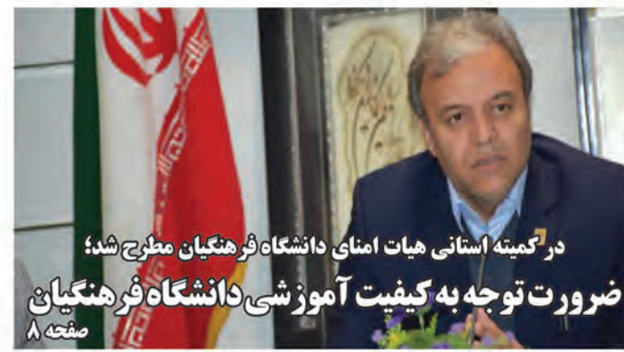
در کمیته استانی هیات امنای دانشگاه فرهنگیان مطرح شد؛ ضرورت توجه به کیفیت آموزشی دانشگاه فرهنگیان صفحه ۸