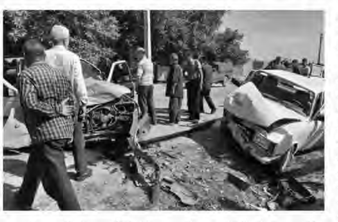
پلاک مخدوش اعمال قانون شده اند. وی ادامه داد: چنانچه در مشخصات پلاک

رئیس پلیس راهنمایی و رانندگی خراسان جنوبی گفت: در سه ماه نخست امسال ۱۰ نفر در تصادفات درون شهری استان فوت کردند که ۷۰ درصد از متوفیان قشر جوان زیر ۲۵ سال بوده اند. سرهنگ علیرضا عباسی در گفت و گو با ایرنا افزود: از ابتدای امسال تا کنون بالغ بر هزار و ۸۷۴ فقره تصادف در معابر درون شهری استان رخ داده است. وی بیان کرد: با شیوع کرونا و مجازی بودن آموزش ها، نظارت خانواده ها بر دانش آموزان کاهش یافته و به همین دلیل بیش از ۳۰ درصد تصادفات رانندگی در این رده سنی بوده است. رئیس پلیس راهنمایی و رانندگی خراسان جنوبی با اشاره به اینکه در سه ماه اول