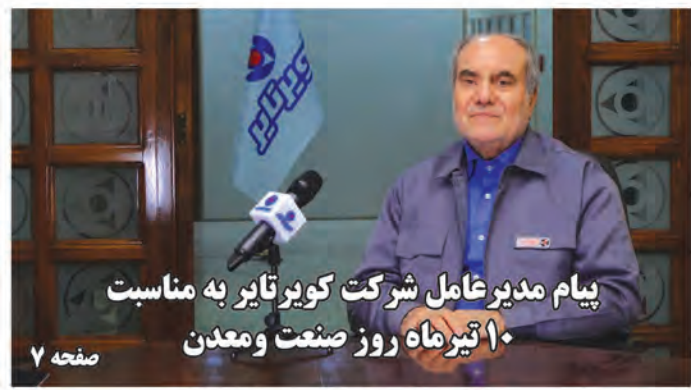
پیام مدیرعامل شرکت کویرتایر به مناسبت ۱۰ تیرماه روز صنعت و معدن صفحه ۷