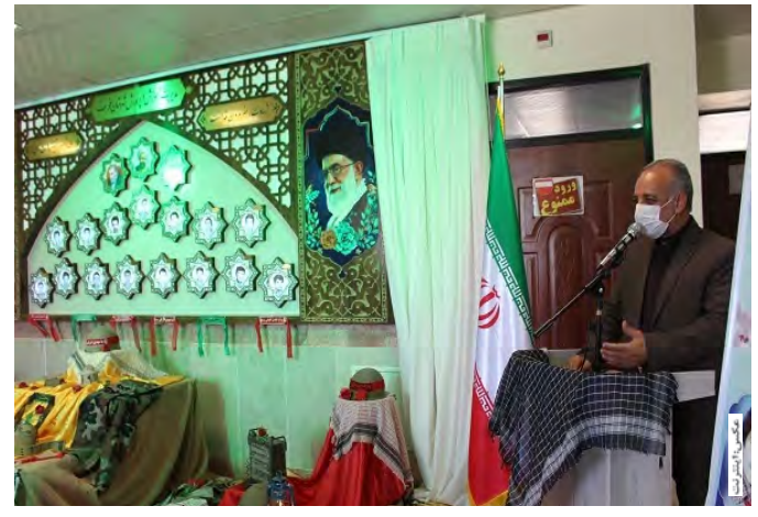
تمامی پیشرفت‌ها و دستاوردهای امروز ایران اسلامی ثمره خون شهدای مدافع حرم و حرم است. مدیر کل آموزش و پرورش خراسان جنوبی

شهادت استوار بوده و همچنان این امر در قاموس اسلام و نظام مقدس جمهوری اسلامی متداول است. دبیر شورای آموزش و پرورش خراسان جنوبی، انتقال فرهنگ ایثار و شهادت به نسل آینده را مهم‌ترین رویکرد آموزش و پرورش بر اساس سند تحول بنیادین و ساحت‌های ۶ گانه آن برشمرد و تصریح کرد: مردم علی‌رغم شیوع بیماری کرونا و فتنه‌ها، با حضور در انتخابات راه شهدا را تبیین کردند و استان خراسان جنوبی از این منظر، سرآمد در کشور بود. به گفته واقعی، معلمان شهرستان خوسف در برگزاری کلاس‌های حضوری، علی‌رغم تهدید بیماری کرونا، به خوبی ایفای نقش کرده و برای پیشرفت تحصیلی دانش‌آموزان شهرستان بی‌وقفه تلاش و مجاهدت می‌کنند.