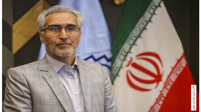
مراکز ما مراجعه می‌کنند و گروه هدف هستند یعنی گروه سنی بالای ۷۰ سال انجام می‌شود، تزریق واکسن ایرانی که در حال حاضر تزریق واکسن برایشان

هم در دستور کار قرار می‌گیرد. رییس دانشگاه علوم پزشکی بیرجند گفت: البته تعداد واکسن ایرانی که به دست ما رسیده هنوز محدود است و در پارت اول هزار دوز و اخیراً هم ۵۰۰ دوز واکسن کوو برکت تحویل ما شده است. وی بیان کرد: به تدریج میزان واکسنی که به استان‌ها و دانشگاه‌ها تحویل خواهد شد، افزایش قابل توجهی خواهد داشت و براساس گروه‌های سنی هدف که اعلام می‌شود، از جمله واکسن‌هایی که در دستور کار تزریق قرار می‌گیرد، واکسن کوو برکت نیز خواهد بود.