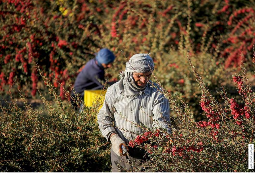
امروز خراسان جنوبی _ گروه خبر

راه اندازی سازمان زرشک و عناب در سفر وزیر جهاد کشاورزی به استان در مهرماه سال گذشته توسط استاندار وقت خراسان جنوبی پیشنهاد و مورد موافقت وزیر هم قرار گرفت. رئیس سازمان جهاد کشاورزی استان هم در آخرین پیگیری های خبرنگار ما در مورد این مصوبه از تهیه طرح اولیه این سازمان و ارسال آن برای بررسی بیشتر به وزارت جهاد کشاورزی خبر داده بود.قوسی در این گفت وگو هم چنین عنوان کرده‌با توجه به اینکه راه اندازی یک سازمان مستقل مانند زرشک و عناب مستلزم جذب نیروی انسانی و چارت مجزایی است احتمال رد این پیشنهاد وجود دارد.موضوعی که روز گذشته توسط معاون برنامه ریزی و امور اقتصادی جهاد کشاورزی هم بر آن صحه گذاشته شد.