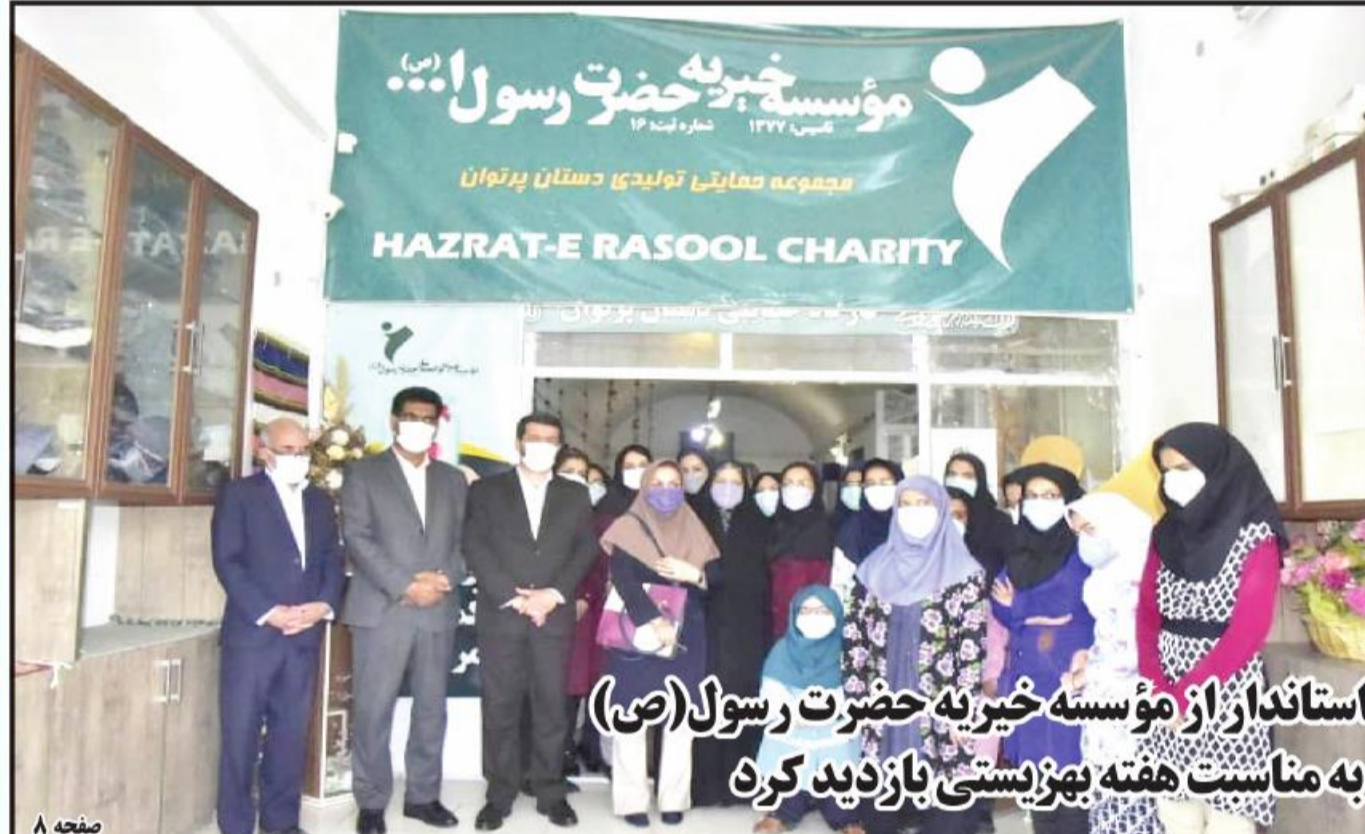
استاندار از مؤسسه خیریه حضرت رسول (ص) به مناسبت هفته بهزیستی بازدید کرد