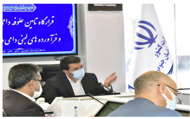
خشکسالی است، ناکافی بودن علوفه یارانه ای تعیین شده از سوی دولت، پایین بودن قیمت تولیدات دامداران، بالا بودن کرایه حمل نهاده ها و عدم رغبت کامیون دارن برای حمل از جمله مشکلاتی است.

دستور ویژه استاندار برای خرید اورژانسی دام های مازاد