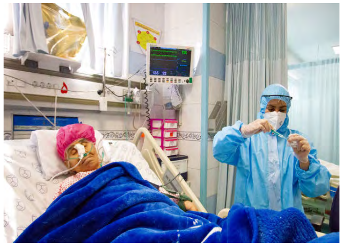
۸ نفر وخیم است. وی افزود: در شبانه روز گذشته ۷۵ بیمار با علائم تنفسی در بیمارستان های استان پذیرش شدند که در همین مدت مراقبت های ویژه بستری هستند که