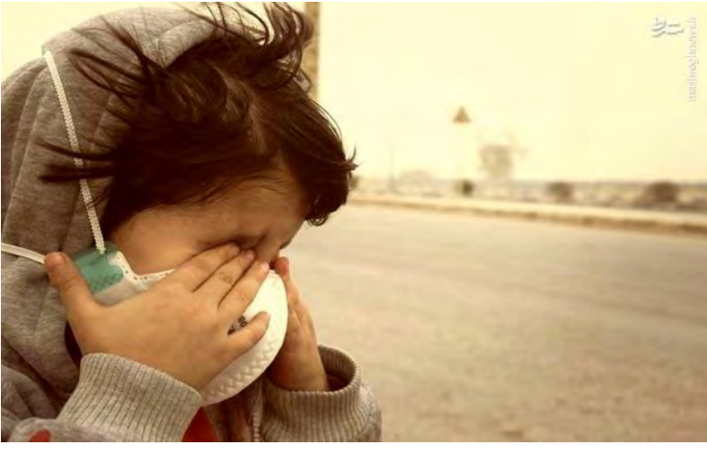
افزایش یابد. وی افزود:متاسفانه با پیش بینیهایی جهانی این روند صعودی ادامه خواهد داشت.

ریزگردها دغدغه ای که در خراسان جنوبی جدی گرفته نشده