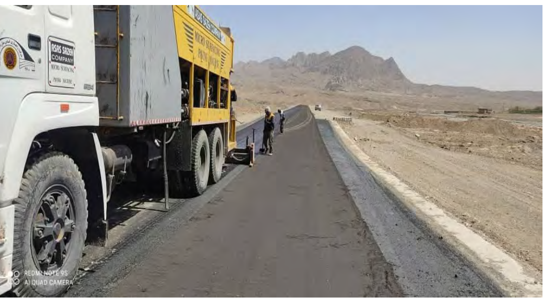
اجرای آسفالت اسلاری