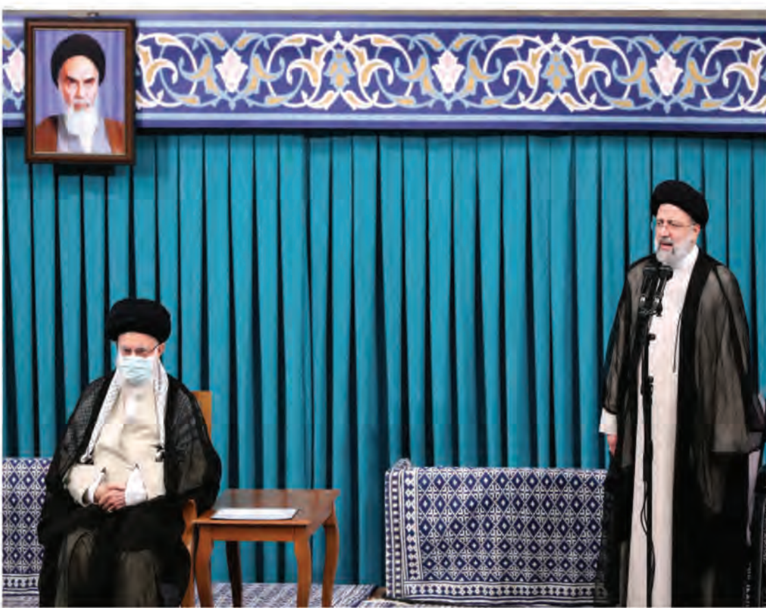
برگزاری مراسم تنفیذ سیزدهمین دوره ریاست جمهوری اسلامی با تبارگسترده ای در رسانه ها و اندیشکده های عربی به دنبال داشت و تأکید سید ابراهیم ریسی در سخنرانی خود بر روی حل مشکلات اقتصادی، خدمت به مردم و ایجاد تحول در این رسانه ها پر رنگ بود.