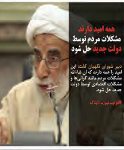
همه امید دارند مشکلات مردم توسط دولت جدید حل شود