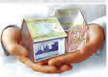
مدیرکل بنیاد مسکن انقلاب اسلامی خراسان جنوبی از آغاز پرداخت تسهیلات