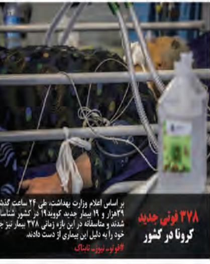
۳۷۸ فوتی جدید کرونا در کشور

رهبر انقلاب در سخنانی در مراسم تنفیذ سید ابراهیم ریسی گفت: ما باید با مردم صادقانه حرف بزنیم. مردم می خواهند بدانند که چه می کند، چه می خواهد و چه می تواند. ما باید با مردم صادقانه حرف بزنیم و با آنها در مورد مسائل مختلف گفتگو کنیم. ما باید با مردم صادقانه حرف بزنیم و با آنها در مورد مسائل مختلف گفتگو کنیم.