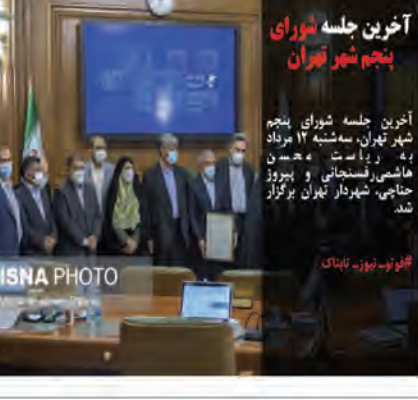
آخرین جلسه شورای پنجم شهر تهران، سه شنبه ۱۱ مرداد ماهی، فسخیاتی و پروژهای شهرداری تهران برگزار شد.