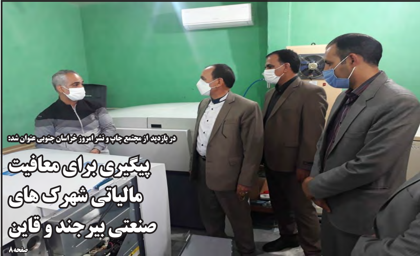
در بازدید از مجتمع چاپ و نشر امروز خراسان جنوبی عنوان شده:

براساس گزارش بانک مرکزی از وضعیت کل مانده سپرده‌ها و تسهیلات ریالی و ارزی بانکها و مؤسسات اعتباری به تفکیک استان در پایان فروردین سال جاری، مانده کل سپرده‌ها به رقم ۳۸۹۰ هزار و ۴۰۰ میلیارد تومان رسیده است که نسبت به پایان سال قبل و مقطع مشابه در یک سال معادل ۴/۱ و ۴۰/۱ درصد افزایش را نشان می‌دهد. همچنین، بالاترین مبلغ سپرده‌ها مربوط به استان تهران با مانده ۲۰۸۱ هزار و ۵۰۰ میلیارد تومان و کمترین مبلغ مربوط به استان کهگیلویه و بویراحمد معادل ۹۹۰۰ میلیارد تومان است. علاوه بر این، مانده کل تسهیلات در این زمان ۲۸۰۳ هزار و ۳۰۰ میلیارد تومان است که نسبت به فروردین و پایان سال گذشته به ترتیب معادل ۴۳/۳ و ۴/۰ درصد افزایش داشته است. براساس گزارش بانک مرکزی از وضعیت کل مانده سپرده‌ها و تسهیلات ریالی و ارزی بانکها و مؤسسات اعتباری به تفکیک استان‌ها در پایان فروردین ماه سال جاری، کل سپرده‌ها در خراسان جنوبی ۱۷۰ هزار و ۷۵ میلیارد ریال بوده است. بیشترین مبلغ تسهیلات نیز مربوط به استان تهران با مانده ۱۷۸۴ هزار و ۴۰۰ میلیارد تومان و کمترین مبلغ مربوط به استان کهگیلویه و بویراحمد معادل ۹۵۰۰ میلیارد تومان است.