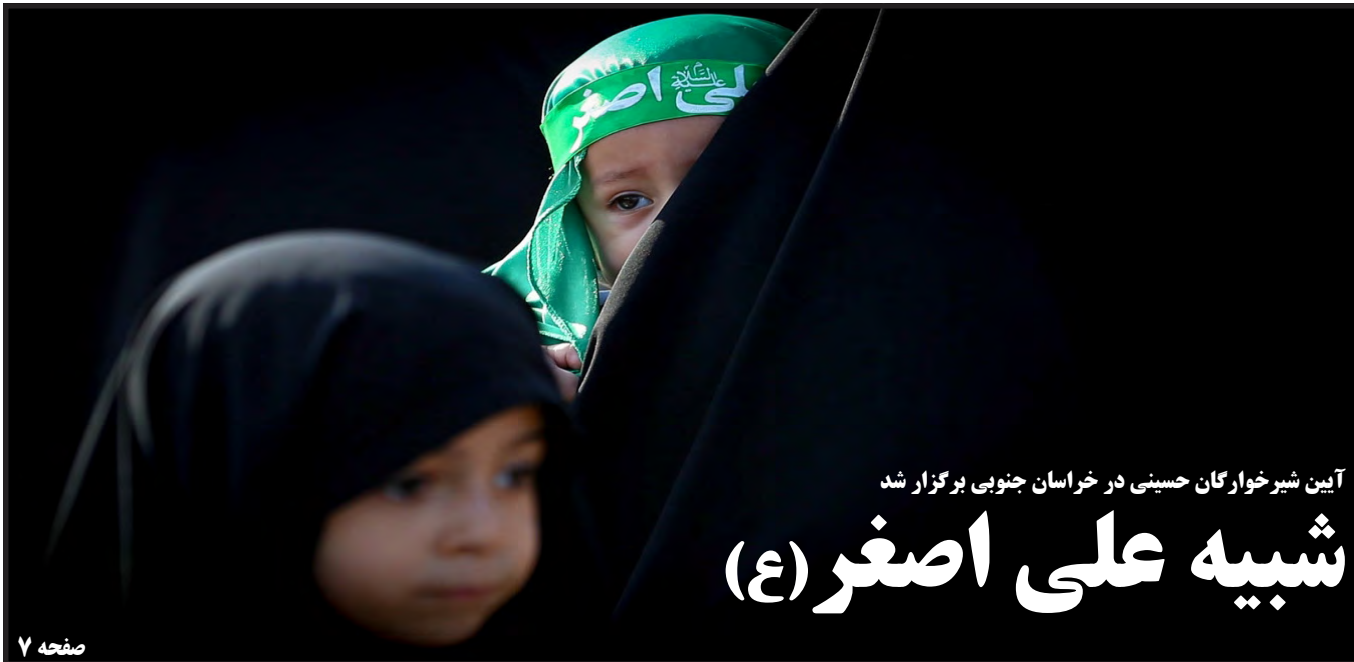
آیین شیرخوارگان حسینی در خراسان جنوبی برگزار شد شبیه علی اصغر(ع)