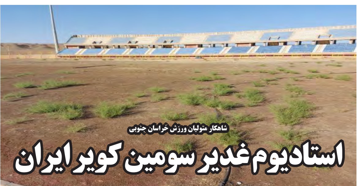
شاهکار مویان ورزش خراسان جنوبی

ایجاد چمن مصنوعی راهکار مناسبی است وی در پایان افزود: همانطور که اشاره شد ما گزارش جامع و مفصلی در خصوص مشکلات پیش آمده به مراجع نظارتی و مسوولین امر ارائه داده ایم.