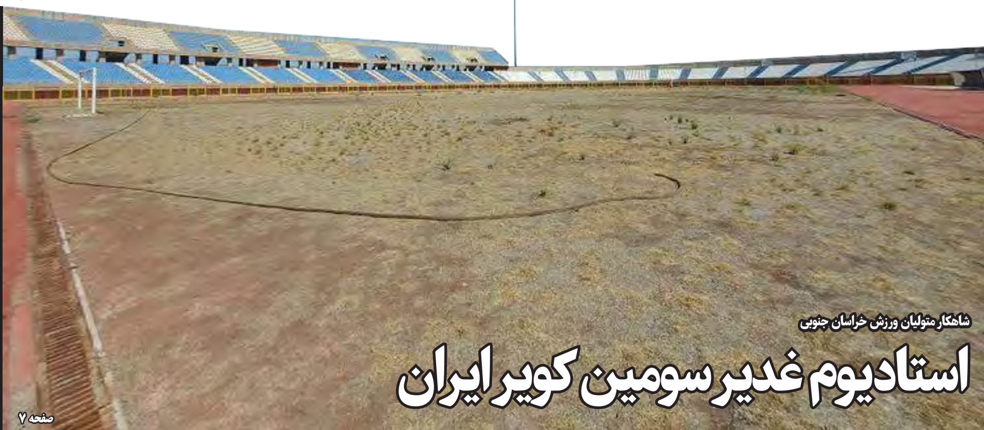
شاهکار متولیان ورزش خراسان جنوبی