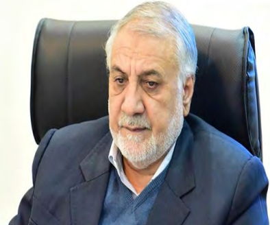
ساعت کاری ادارات استان به روال قبل بازگشت صفحه ۳

۲۰ هزار دانش آموز در مدارس ۲ نوبته تحصیل می کنند صفحه ۲