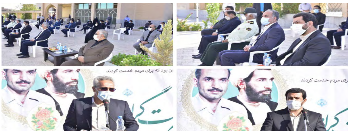
رای مردم خدمت کردند. این بود که برای مردم خدمت کردند.

در آیین گرامیداشت آغاز هفته دولت و روز پزشک اعلام شد: