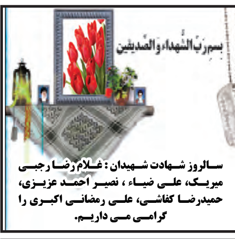
بسم رب الشهداء و الصدیقین