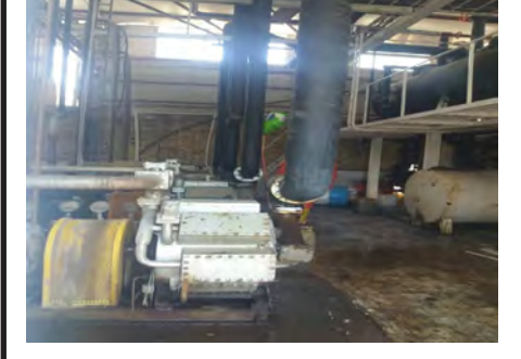
مهار نشت گاز آمونیاک در شهرک صنعتی بیرجند