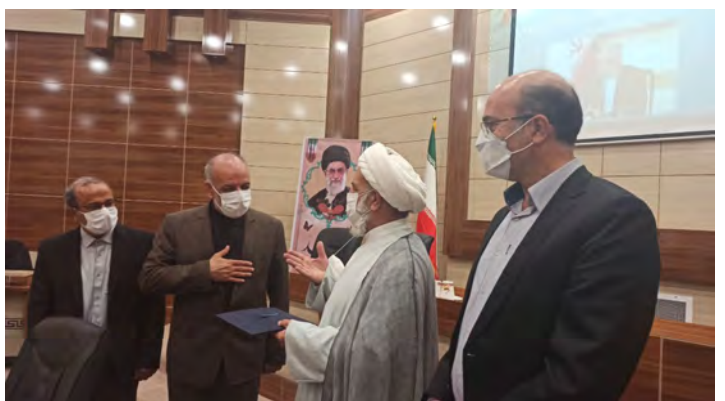
مدیر کل آموزش و پرورش خراسان جنوبی از مرمت، بهسازی و زیباسازی ۷۰ مدرسه فردوس در آستانه سال جدید تحصیلی با اعتباری بالغ بر ۵۰۰ میلیون تومان توسط شورای پروژه مهربان شهرستان خبر داد.

پروژه مرمت و بهسازی ۷۰ مدرسه فردوس در آستانه سال تحصیلی بدو دغدغه دانش آموزان برای شرایط مختلف برنامه های متفاوتی پیش بینی کرده که در صورت نیاز مورد استفاده قرار خواهند گرفت. دبیر شورای آموزش و پرورش خراسان جنوبی، با اشاره به توزیع ۱۴ هزار لیتر صابون مایع و مواد ضد عفونی کننده (دست و سطح) و بعلاوه ۹۲۰۰ ماسک، در سال تحصیلی گذشته به منظور برگزاری کلاس ها و آزمون های حضوری بین مدارس فردوس، تصریح کرد: در حال حاضر ۳۰ درصد مدارس فردوس تخریبی هستند که باید در خصوص جانمایی و یا احداث ساختمان استاندارد در زمین قبلی این آموزشگاه مطابق اولویت بندی از سوی اداره کل نوسازی، توسعه و تجهیز مدارس بازسازی، تسریع شود.