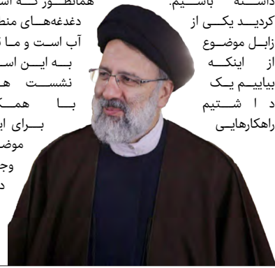
رهبر اهل بیت

رئیس جمهور در ادامه سفر به استان سیستان و بلوچستان، شامگاه پنجشنبه در جمع نمایندگان اقشار، علما و نجیبان چابهار، مردم این منطقه را دین مدار، ولایت مدار و دارای فرهنگ و تمدن غنی خواند و با اشاره به موضوعات و مشکلات مطرح شده از سوی حاضران در این نشست، گفت: مسأله کپرنشینی در سیستان و بلوچستان باید تا پایان سال جاری سامان یابد. سواحل مکران می تواند قطب رونق و ارتباطات تجاری و اقتصادی با دنیا باشد. افزایش تولید و اشتغال دو مسأله بسیار مهم کشور است. مسائل مطرح شده هم از سوی وزرا و هم در حوزه معاونت اجرایی ریاست جمهوری با حضور نمایندگان از منطقه پیگیری خواهد شد و به شکل مفصل در شورای اداری استان مورد بررسی قرار می گیرد.