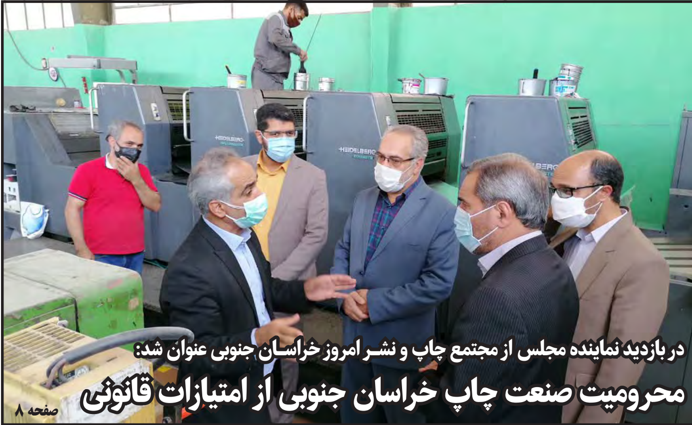
در بازدید نماینده مجلس از مجتمع چاپ و نشر امروز خراسان جنوبی عنوان شد: محرومیت صنعت چاپ خراسان جنوبی از امتیازات قانونی

افزایش ۴ برابری سه‌میه دلاری مرزنشینان استان صفحه ۲