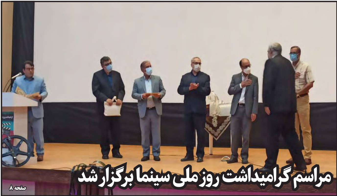
مراسم گرامیداشت روز ملی سینما برگزار شد

* انتقاد رئیس کل دادگستری از نحوه مدیریت پسماند * فعالیت ۶۰۸ زباله گرد * ۹۰۰ هکتار زمین خالی در بیرجند وجود دارد صفحه ۴