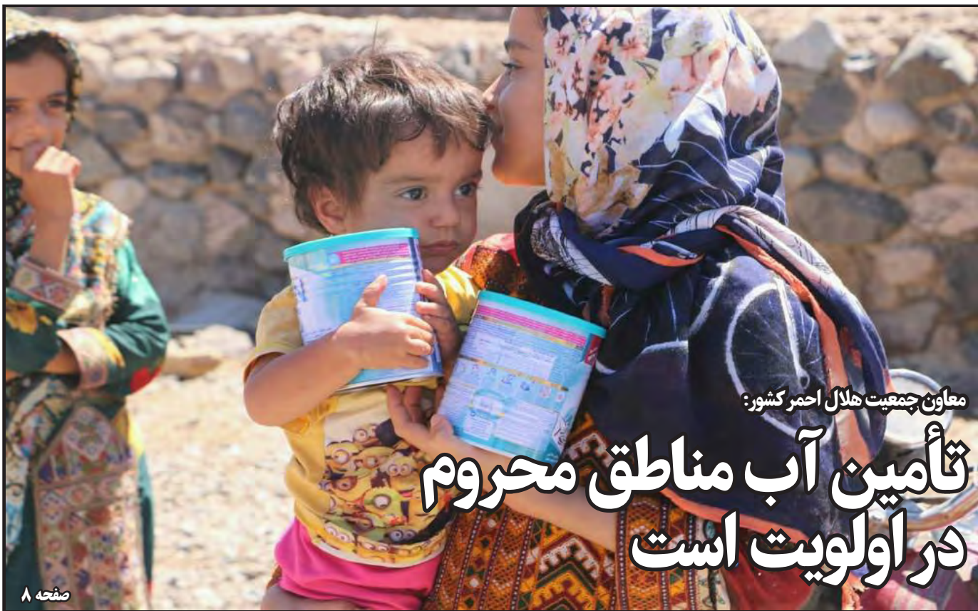
معاون جمعیت هلال احمر کشور: