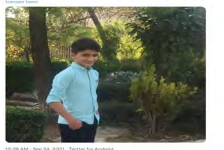
10:28 AM · Sep 24, 2021 · Twitter for Android

دو خابرو رو از آتش سوریه نجات داد و خودش به خاطر شدت سوختگی امروز بر کشید.