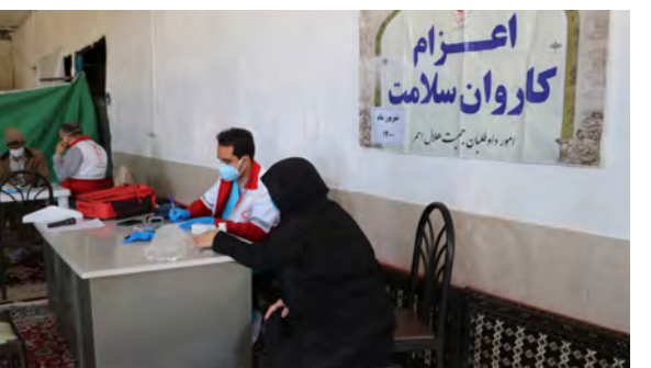
رايگان به ارزش ۵۰ میلیون ریال به مراجعه کنندگان از دیگر فعالیتهای کاروان در این روستاها بوده است.

رئیس جمعیت هلال احمر شهرستان بیرجند گفت: همچنین تعداد ۳۰ نفر از روستائیان در کلاس امداد و کمک های اولیه در حاشیه اجرای این طرح شرکت کردند. وی گفت: در این کاروان تعداد ۳ پزشک عمومی داوطلب و دو نفر از خواهران داوطلب برای تست فشار خون افراد به مدت دو روز مشارکت داشته اند. ذاکریان از خدمات سلامت محور به اقشار نیازمند جامعه را از جمله اهداف این کاروان دانست و گفت: همچنین فعالیت این تیمها در مناطق محروم باعث ارتقای سطح سلامت روستائیان و تزریق روحیه امید به آن ها می شود.