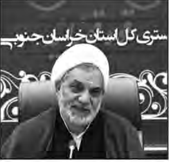
رئیس کل استان خراسان جنوبی