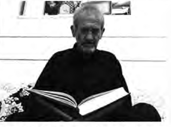
مددجوی ۸۰ ساله کمیته امداد سرایان، با وجود نداشتن سواد، حافظ کل قرآن است و تاکنون شاگردان زیادی را آموزش داده است. به گزارش خبرگزاری