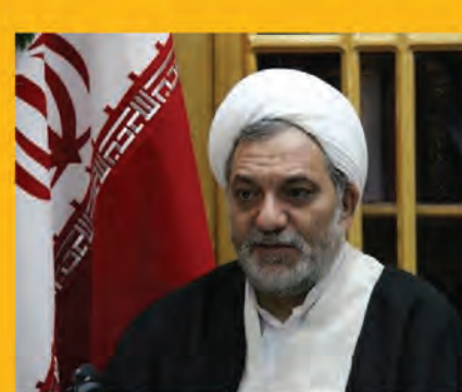
ارتقای رضایت عمومی مهمترین رویکرد سند تحول قضایی است صفحه ۳