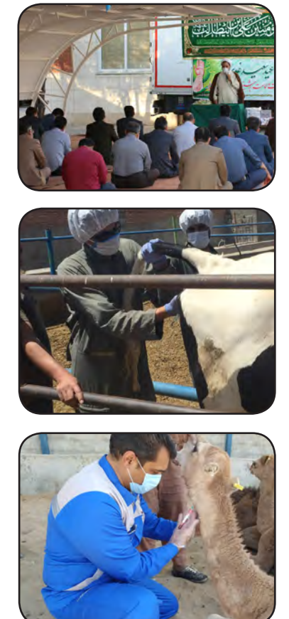
پایش استخرهای پرورش ماهی نیز انجام می گیرد. در حوزه بهداشت و بیماری های دامی و اکسیناسیون ۳۱۶۷۵۶ رأس گوسفند و بز، ۳۱۳۳ رأس گاو و گوساله، ۲۰۸ نفر شتر و ۶۹۶ قطعه شتر مرغ که در کشتارگاه شهرداری کشتار گردیده انجام گردیده است. همچنین در ایام محرم نظارت ویژه نیز بر ذبح دام نذری با حضور بازرس بهداشتی و ناظر ذبح شرعی انجام می گیرد. در حوزه دارو و درمان نیز استان خراسان جنوبی دارای ۲۶ واحد داروخانه، ۳۵ مرکز واکسیناسیون و کلینیک دامپزشکی است که به صورت شبانه روزی، به بهره برداران خدماتی از جمله درمان دام و طیور و اکسیناسیون ارائه می شود و از ابتدای سال با مراجعه ۱۳ هزار و ۵۰۰ بهره بردار به ۵۱ هزار و ۷۸۲ رأس گوسفند و بز، ۵۸ هزار و ۳۰۰ رأس گاو و گوساله و ۱۶ میلیون و ۹۶۹ قطعه طیور توسط این مراکز خدمات درمانی داده شده است. در حوزه قرنطینه و امنیت زیستی نیز در شش ماهه اول سال ۲۸۷۲۴۴ کیلو گرم موی بز به کشور افغانستان صادر شده است.