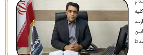
گوشته شهرستان نهبندان از ابتدای سال تاکنون اقدام به تعداد ۸۵۰ هزار قطعه جوجه ریزی نموده اند که کلیه فعالیت ها اعم از جوجه ریزی، واکسیناسیون، نظارت، بررسی تلفات و دریافت مجوز حمل به کشتارگاه در این واحدها تحت نظارت مستقیم شبکه دامپزشکی می باشد تا مرغ سالم و بهداشتی به دست مصرف کننده برسد.

کارشناسان نظارت شبکه دامپزشکی شهرستان نهبندان بر حدود ۶۰۰ کانکتیو حامل فرآورده های خام دامی وارد به شهرستان نظارت داشته و همچنین تعداد ۲۸۰ بازدید از مراکز عرضه فرآورده های خام دامی، رستوران ها و... را انجام داده اند که حاصل این نظارت ها تأمین مواد غذایی سالم بر سر سفره مردم شهرستان می باشد. واحدهای مرغ