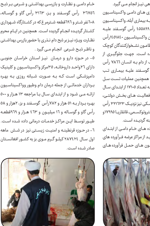
پایش استخرهای پرورش ماهی نیز انجام می گیرد. در حوزه بهداشت و بیماری های دامی و اکسیناسیون ۳۱۶۷۵۶ رأس گوسفند و بز، ۳۱۳۳ رأس گاو و گوساله، ۲۰۸ نفر شتر و ۶۹۶ قطعه شتر مرغ که در کشتارگاه شهرداری کشتار گردیده انجام گردیده است. همچنین در ایام محرم نظارت ویژه نیز بر ذبح دام نذری با حضور بازرس بهداشتی و ناظر ذبح شرعی انجام می گیرد. در حوزه دارو و درمان نیز استان خراسان جنوبی دارای ۲۶ واحد داروخانه، ۳۵ مرکز واکسیناسیون و کلینیک دامپزشکی است که به صورت شبانه روزی، به بهره برداران خدماتی از جمله درمان دام و طیور و اکسیناسیون ارائه می شود و از ابتدای سال با مراجعه ۱۳ هزار و ۵۰۰ بهره بردار به ۵۱ هزار و ۷۸۲ رأس گوسفند و بز، ۵۸ هزار و ۳۰۰ رأس گاو و گوساله و ۱۶ میلیون و ۹۶۹ قطعه طیور توسط این مراکز خدمات درمانی داده شده است. در حوزه قرنطینه و امنیت زیستی نیز در شش ماهه اول سال ۲۸۷۲۴۴ کیلو گرم موی بز به کشور افغانستان صادر شده است.

پایش استخرهای پرورش ماهی نیز انجام می گیرد. ۳- در حوزه بهداشت و بیماری های دامی و اکسیناسیون ۳۱۶۷۵۶ رأس گوسفند و بز، ۳۱۳۳ رأس گاو و گوساله، ۲۰۸ نفر شتر و ۶۹۶ قطعه شتر مرغ که در کشتارگاه شهرداری کشتار گردیده انجام گردیده است. همچنین در ایام محرم نظارت ویژه نیز بر ذبح دام نذری با حضور بازرس بهداشتی و ناظر ذبح شرعی انجام می گیرد. ۵- در حوزه دارو و درمان نیز استان خراسان جنوبی دارای ۲۶ واحد داروخانه، ۳۵ مرکز واکسیناسیون و کلینیک دامپزشکی است که به صورت شبانه روزی، به بهره برداران خدماتی از جمله درمان دام و طیور و اکسیناسیون ارائه می شود و از ابتدای سال با مراجعه ۱۳ هزار و ۵۰۰ بهره بردار به ۵۱ هزار و ۷۸۲ رأس گوسفند و بز، ۵۸ هزار و ۳۰۰ رأس گاو و گوساله و ۱۶ میلیون و ۹۶۹ قطعه طیور توسط این مراکز خدمات درمانی داده شده است. ۶- در حوزه قرنطینه و امنیت زیستی نیز در شش ماهه اول سال ۲۸۷۲۴۴ کیلو گرم موی بز به کشور افغانستان صادر شده است.