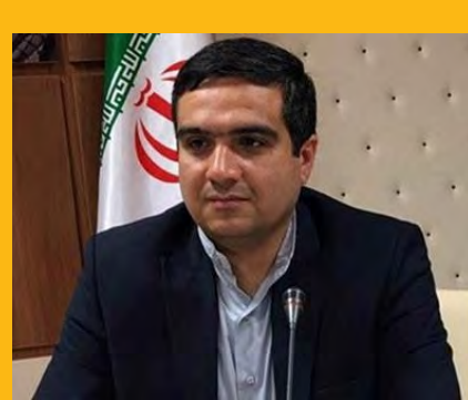
ناعدالتی در خرید زرشک و زعفران