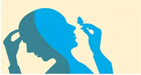
تصویرسازی از یک فرد با مشکلات روانی که در حال دست زدن به گوشه‌های سرش است.

بهداشت روان یا سلامت روان به معنی سلامت هیجانی و روانشناختی است، به شکلی که فرد بتواند از تفکر و توانایی های خود استفاده کند، در جامعه عملکرد داشته باشد و نیازهای معمول زندگی روزمره را برآورده سازد. پیشگیری از پیدایش بیماری های روانی و سالم کردن محیط روانی از نیازهای اولیه تامین بهداشت روانی محسوب می شود. فردی که می تواند به فشارهای معمول زندگی روزمره غلبه کند و یک زندگی مستقل داشته باشد را می توان به عنوان یک فرد دارای سلامت روان معرفی کرد. سلامت روان به معنی آرامش فیزیکی و کمبود سر و صدا نیست بلکه معنای کلی تری دارد و کیفیت زندگی بر آن تأثیری می گذارد. سلامت روان روی طرز فکر، احساس و رفتار روزانه شما تأثیر دارد و همچنین روی توانایی شما در مواجهه با استرس، غلبه بر چالش های زندگی، ساخت روابط و ریکاوری بعد از سختی ها تأثیرگذار می باشد. سلامت قوی ذهن به این معنا نیست که هیچ مشکلی نداشته باشید، سلامت روانی و احساسی چیزی فراتر از رهایی از مشکلات افسردگی، اضطراب و یا دیگر مشکلات روانشناسی می باشد.