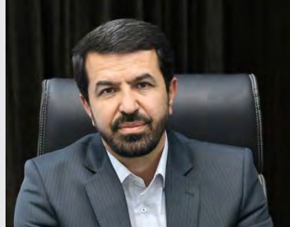
نگاه ویژه به طرح‌های ناتمام استان در مصوبات سفر رئیس جمهوری صفحه ۳

یازدهمین جشنواره کتابخوانی رضوی در استان برگزار می‌شود صفحه ۲