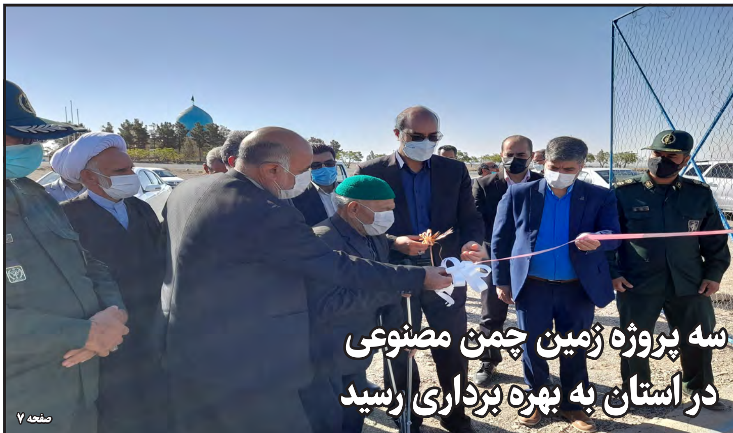
سه پروژه زمین چمن مصنوعی در استان به بهره‌برداری رسید

نصب و راه اندازی پیشرفته‌ترین دستگاه MRI در قاین صفحه ۲