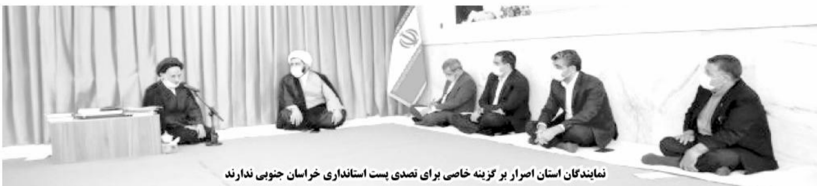
نمایندگان استان اصرار بر گزینه خاصی برای تصدی پست استانداری خراسان جنوبی ندارند