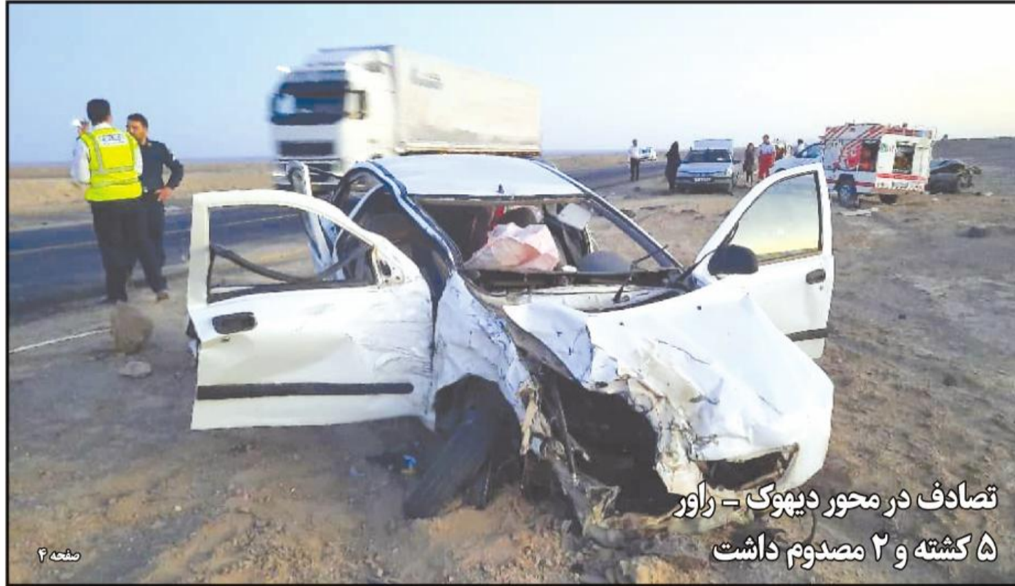
تصادف در محور دیهوک - راور ۵ کشته و ۲ مصدوم داشت

پرندگان مبتلا به آنفلو آنزای فوق حاد در مان نمی‌شوند