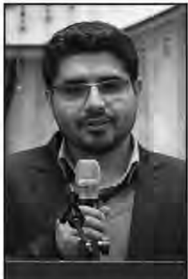
مسئول فضای مجازی سپاه انصارالرضا(ع) خراسان جنوبی با بیان اینکه سومین رویداد تولید محتوای دیجیتال بسج در حال برگزاری است، گفت: یکی از مشخصات خوب سومین رویداد این است که بر اساس مشکلات استانی برنامه ریزی شده است.