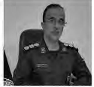
خاطره این شهیدان والامقام با حضور مسئولین محلی و استانی گرامی داشته می شود.

یک شهید در حوازی آباد زیرکوه و یک شهید در حوزه علمیه برداران بیرجند دفن شدهاند. وی با بیان اینکه شهدای گمنام شناسایی شده از استانهای تهران، مشهد، اصفهان و اهواز هستند، گفت: همچنین دو تن از شهدا متعلق به شهدای ارتش و دو تن متعلق به شهدای سپاه هستند و تا این لحظه اسامی شهدا اعلام نشده است. مدیر کل حفظ آثار و نشر ارزشهای دفاع مقدس خراسان جنوبی افزود: با هماهنگیهای صورت گرفته، بازماندگان شهدای والا مقام به زودی به خراسان جنوبی مراجعه و در مراسمی یاد