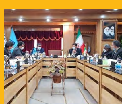
با پیگیری های استاندار محقق شد: موافقت ایمیدرو با نصب ۲ چرخ ریخته گری در فولاد قاینات صفحه ۲

خراسان جنوبی رتبه اول کشور در تأخیر مراجعه به مراکز درمانی بعد ابتلا به کرونا صفحه ۵