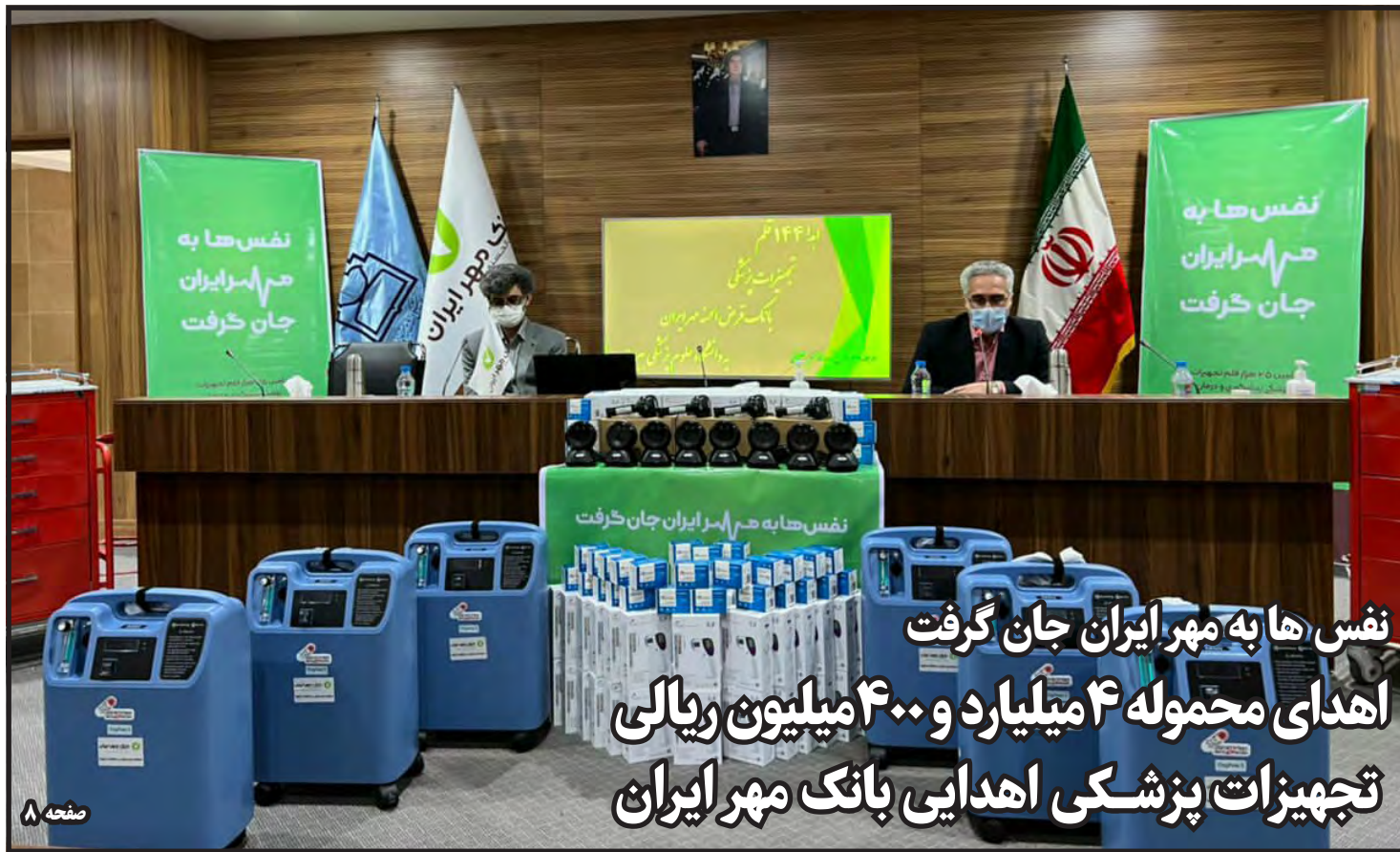
نفس ها به مهر ایران جان گرفت اهدای محموله ۴ میلیارد و ۴۰۰ میلیون ریالی تجهیزات پزشکی اهدایی بانک مهر ایران

تصویب احداث کارخانه آجر نسوز در قاینات با سرمایه گذاری شستا صفحه ۲