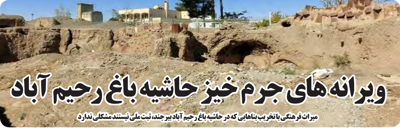
میراث فرهنگی با تخریب بناهایی که در حاشیه باغ رحیم آباد بیر جند، ثبت ملی نیستند مشکلی ندارد

فرمانده انتظامی شهرستان "تهندگان" از کشف ۷۲ کیلو و ۷۵۰ گرم تریاک در بازرسی از سواری سمند در این شهرستان خبر داد و گفت: در این رابطه ۲ متهم دستگیر شده است. به گزارش امروز خراسان جنوبی، سرهنگ "احسان رحیمی" اظهار داشت: مأموران یگان امداد شهرستان "تهندگان" هنگام کنترل خودروهای عبوری در محورهای مواصلاتی به یک سواری سمند مشکوک شدند و با علائم هشدار دهنده به راننده خودرو دستور ایست دادند. وی بیان داشت: مأموران پس از هماهنگی با مقام قضائی در بازرسی تکمیلی از سواری سمند ۷۲ کیلو و ۷۵۰ گرم تریاک که به طرز ماهرانه ای در خودرو جاساز شده بود کشف کردند. فرمانده انتظامی شهرستان تهندگان افزود: مأموران در این رابطه یک خودرو توقیف و ۲ متهم دستگیر کردند که متهمان دستگیر شده با تشکیل پرونده جهت سیر مراحل قانونی به مراجع قضائی معرفی شدند.