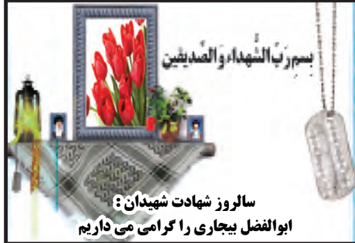
سالروز شهادت شهیدان: ابوالفضل ییغاری را گرامی می داریم

و درود خدا بر او، فرمود: دلهای مردم گریز پا است و به کسی که محبت کند، روی می آورد.