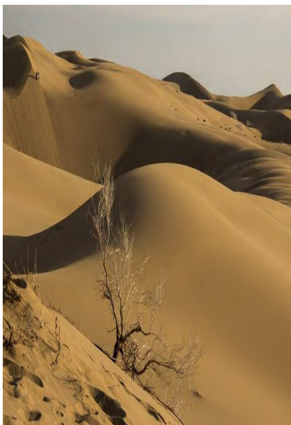
گیاهی و جنگل و مرتع از بین رفته بود لذا امروز در شرایط فعلی علاوه بر آسیب خشکسالی گزارش هایی از برخی تعرض های رسد که باید از آن ممانعت شود و مورد مراقبت دائمی قرار گیرد.

بیابان ها را در استان کنترل کرد و تحت نظارت قرار داد. حجت الاسلام حمیدی افزود: دستور کار دیگر در ارتباط با این مساله بود که برخی افراد و خرده مالکان اطراف شهرها بخصوص شهرستان بیرجند تقاضای الحاق اراضی خودشان به شهر را دارند که با حضور نماینده مالکان در جلسه مسئولان سازمان های مربوطه توضیح دادند و قرار شد این موضوع برای پیگیری و استیفای حقوق مردم به حوزه معاونت عمرانی استانداری خراسان جنوبی منعکس شود.