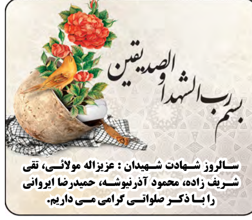
سالروز شهادت شهیدان : عزیزاله مولائی، تقی شریف زاده، محمود آذر نیوشه، حمیدرضا ایروانی را با ذکر صلواتی گرامی می داریم.

و درود خدا بر او، فرمود: شکیبایی دو گونه است: شکیبایی بر آنچه آنرا خوش نمی داری و شکیبایی بر آنچه آنرا دوست می داری.