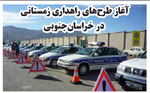
آغاز طرح های راهداری زمستانی در خراسان جنوبی