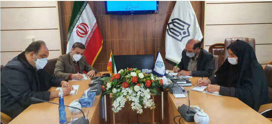
مدیرکل آموزش و پرورش خراسان جنوبی با مدیرکل نوسازی، توسعه و تجهیز مدارس خراسان جنوبی در جلسه‌ای با حضور مدیرکل نوسازی، توسعه و تجهیز مدارس خراسان جنوبی و مدیرکل آموزش و پرورش خراسان جنوبی تفاهم نامه‌ای امضاء کردند.

مدرسه‌ای است که با مشارکت این خیر بزرگوار و اداره کل نوسازی، توسعه و تجهیز مدارس خراسان جنوبی در شهرستان بیرجند احداث خواهد شد و تاکنون دو مدرسه با ۱۲ کلاس درس بهره برداری شده و یک مدرسه ۶ کلاسه ویژه کودکان اوتیسم در شهرستان بیرجند در دست احداث می باشد.