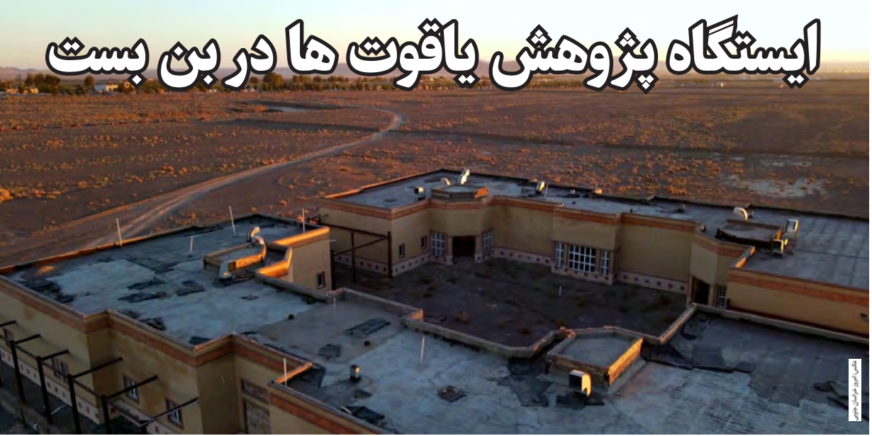
مجموعه آزمایشگاه‌ها در این ایستگاه