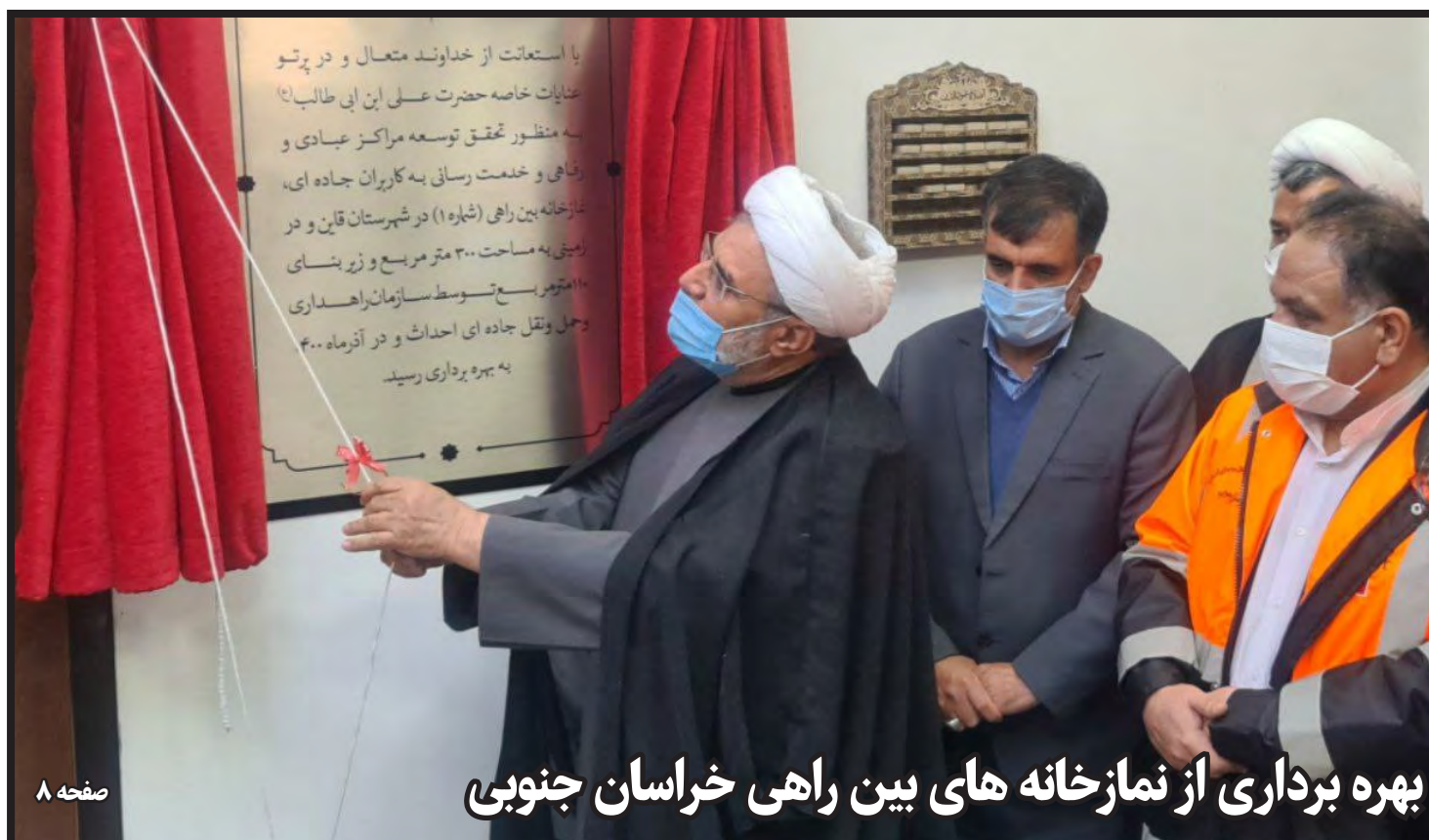
بهره برداری از نمازخانه های بین راهی خراسان جنوبی