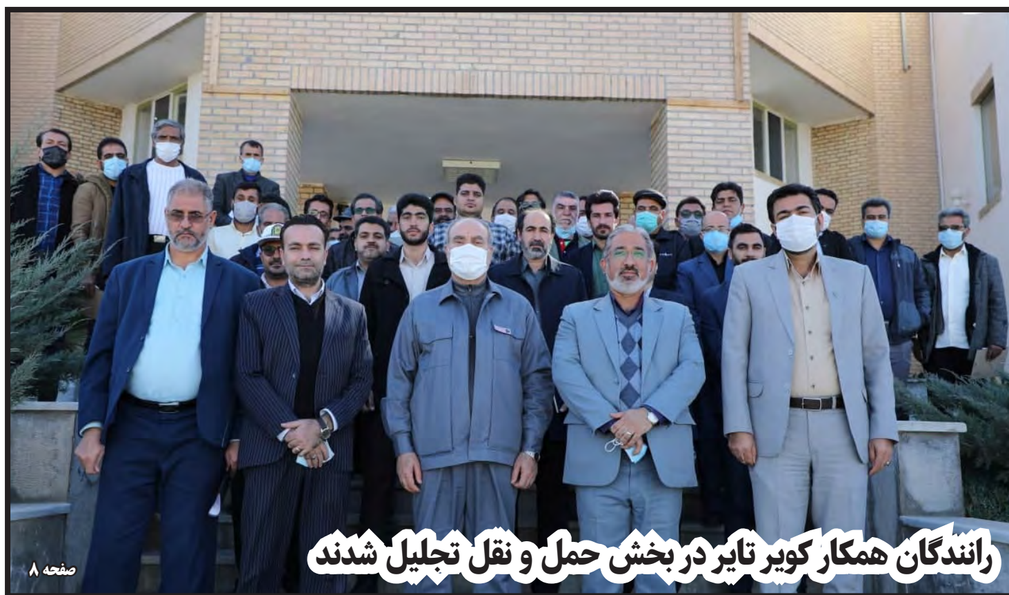
راندگان همکار کویر تایر در بخش حمل و نقل تجلیل شدند