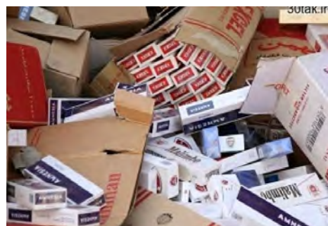
گروه حوادث/ عبداللهی

جریمه ۷۰۰ میلیونی متهم قاچاق لوازم خودرویی سنگین در بیرجند