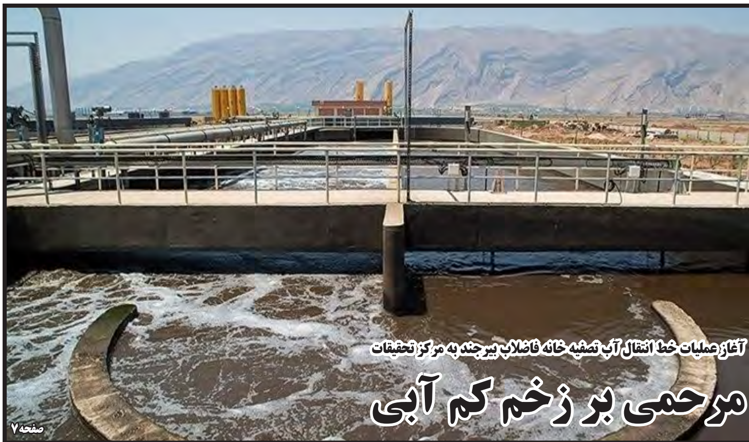
آغاز عملیات خط انتقال آب تصفیه خانه فاضلاب بیرجند به مرکز تحقیقات مرحمی بر زخم کم آبی