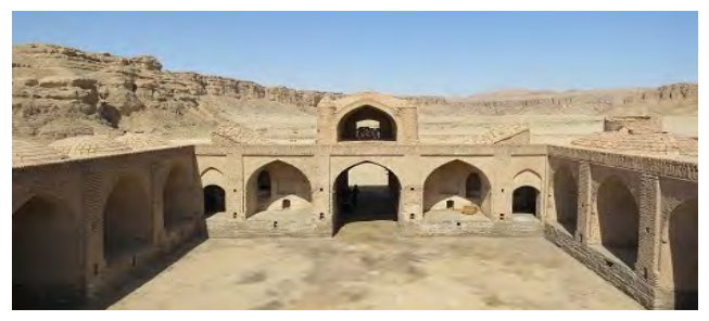
مسیر قدیم طیس به یزد و کاروانسرای چهل پایه در مسیر طیس به راور کرمان