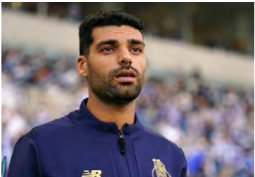
گروه ورزش / دانش