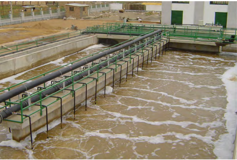
خط انتقال پساب فاضلاب بیرجند به مرکز تحقیقات