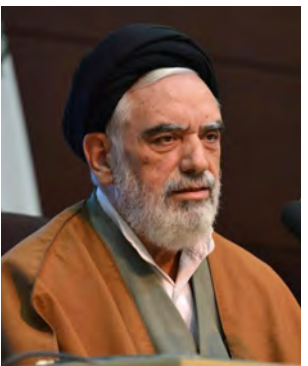
حفظ و ارتقای آنها، توسعه و افزایش رشته‌های مدرسه‌های علمیه خواهران را خواستار شدند.