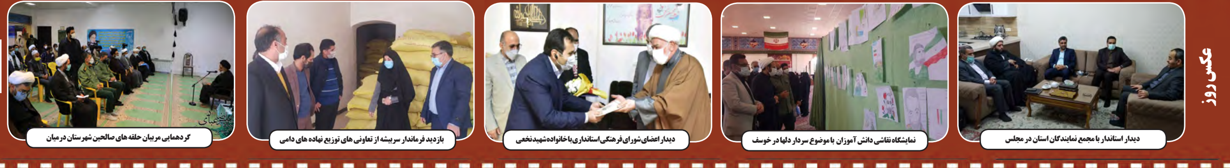
کردهای مریان حله های صالحین شهرستان در بیان | بازدید فرماندار سربیشه از تعاونی های توزیع نهاده های دامی | دیدار اعضای شورای فرهنگی استانداری با خانواده شهید نخعی | نمایشگاه نقاشی دانش آموزان با موضوع سردار دهلاد در خوسف | دیدار استاندار با جمیع نمایندگان استان در مجلس

سفر اعضای تیم ملی کشتی آزاد ایران به آمریکا در حاله ای از ابهام قرار گرفت. بنا بر درخواست فدراسیون کشتی آمریکا، قرار است روز ۲۳ بهمن ماه مسابقاتی دوستانه بین دو تیم ایران و آمریکا در آرلینگتون دالاس در ایالت تگزاس برگزار شود و بر همین اساس نیز هفته گذشته آزادکاران برای اخذ ویزا راهی دبی شدند و گفته می شود در صورتی که آمریکایی ها به همه اعضای کشتی ایران ویزا ندهند، این سفر از سوی فدراسیون کشتی ایران لغو خواهد شد. بنابراین گزارش چند روز پیش فاکس نیوز به دنبال اظهارات ضد آمریکایی علیرضا دبیر واکنش