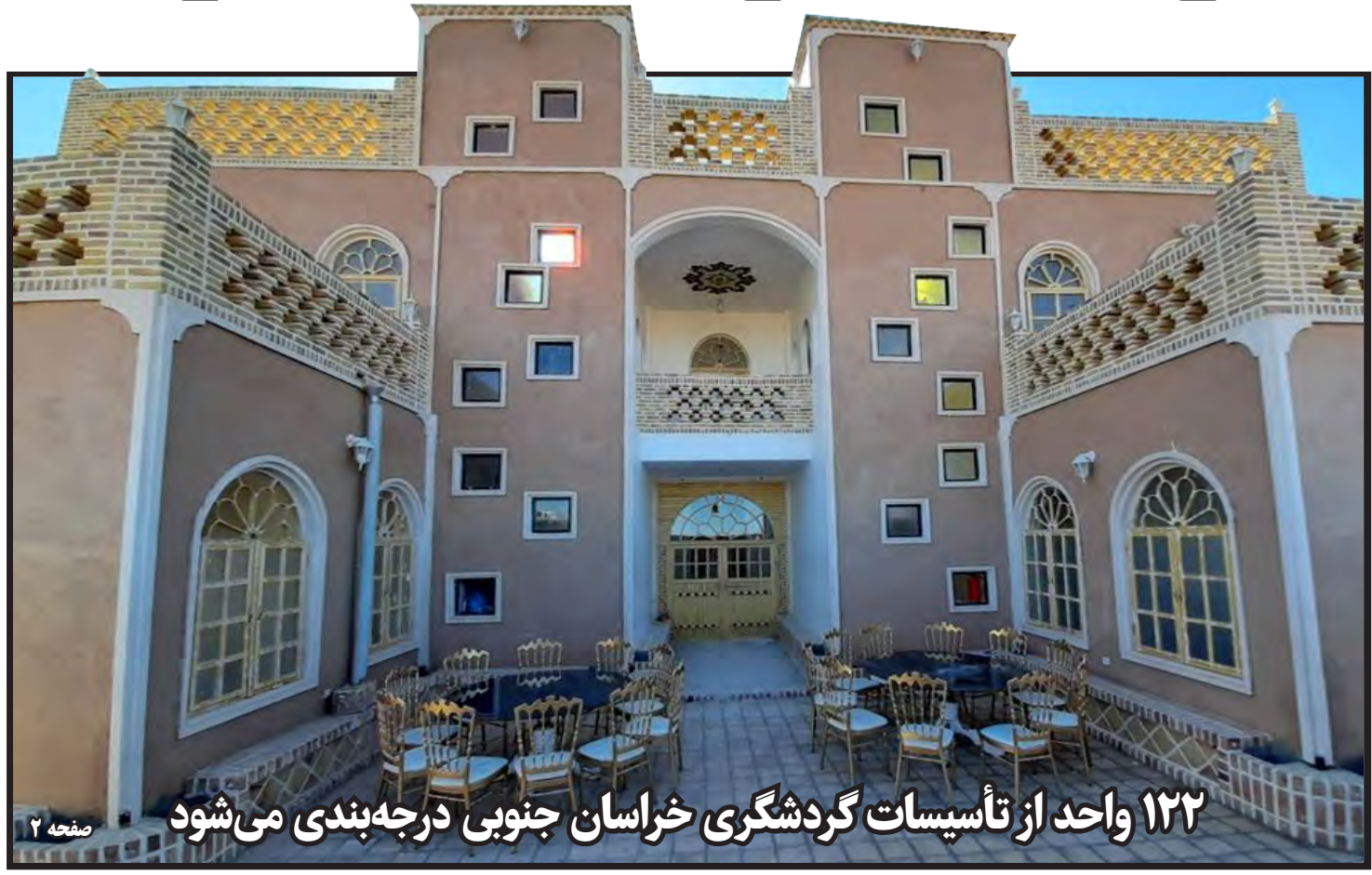
۱۲۲ واحد از تأسیسات گردشگری خراسان جنوبی درجه بندی می شود