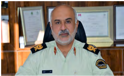
گروه حوادث/ عبدالهی

مأموران انتظامی شهرستان نهبندان، در بازرسی از یک خودروی سواری مواد مخدر صنعتی و سنتی کشف کردند. به گزارش امروز خراسان جنوبی، فرمانده انتظامی استان گفت: مأموران انتظامی شهرستان نهبندان، ۸۱ کیلو و ۱۵۰ گرم حبشیش و ۳۹ کیلو و ۵۰۰ گرم تریاک کشف و ۲ قاچاقچی مواد مخدر را دستگیر کردند. سردار فرشید افروز: مأموران انتظامی نهبندان در راستای اجرای طرح مبارزه با قاچاق مواد مخدر، هنگام گشت زنی در محورهای فرعی این شهرستان به یک سواری پژو ۴۰۵ مشکوک شدند و پس از شناسایی دقیق با علائم هشدار دهنده به راننده آن دستور ایست دادند. وی گفت: راننده سواری پژو به محض مشاهده مأموران پلیس بر سرعت خود افزود و متوقف شد که مأموران با اقدامی منسجم و هماهنگ خودرو را متوقف کردند و در بازرسی از خودرو و پاکسازی مسیر تردد آن، ۸۱ کیلو و ۱۵۰ گرم حبشیش و ۳۹ کیلو و ۵۰۰ گرم تریاک کشف شد.