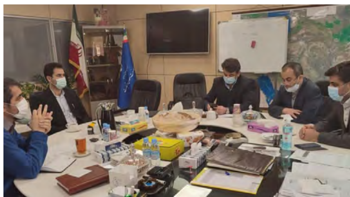
استاندار خراسان جنوبی، تعیین مشوق های لازم برای ترغیب هلدینگ های اقتصادی بزرگ به سرمایه گذاری در استان را خواستار شد.