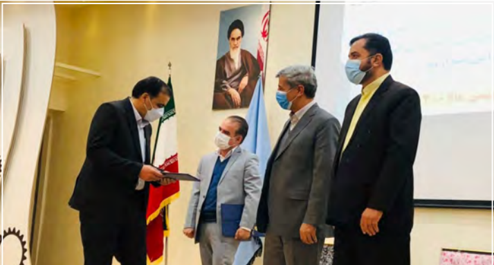
عبور از آموزش های سنتی و حرکت به سمت آموزش های نوین و دانش بنیان

امروز خراسان جنوبی گروه خبر مراسم تودیع و معارفه مدیرکل آموزش فنی و حرفه ای خراسان جنوبی با حضور معاون توسعه و مدیریت سازمان فنی و حرفه ای کشور، معاون سیاسی، امنیتی و اجتماعی استانداری خراسان جنوبی و جمعی از مدیران دستگاه های اجرایی استان برگزار شد. مدیرکل آموزش فنی و حرفه ای خراسان جنوبی در این مراسم با بیان اینکه خراسان جنوبی دارای پتانسیل ها و مواهب بسیار زیادی است، گفت: محصولات کشاورزی و استراتژیک، مرز طولانی مشترک با افغانستان و معادن غنی از جمله این مواهب است که اگر این سرمایه ها شکوفا شوند می توانند استان را در رده استان های برخوردار و دارای ثروت قرار دهند. کارمندی فرد با بیان اینکه حلقه مفقوده بالفعل کردن این ظرفیت های بالقوه، توانمندسازی نیروهای انسانی است، گفت: این