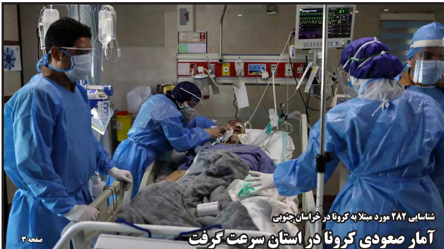
شناسایی ۲۸۲ مورد مبتلا به کرونا در خراسان جنوبی