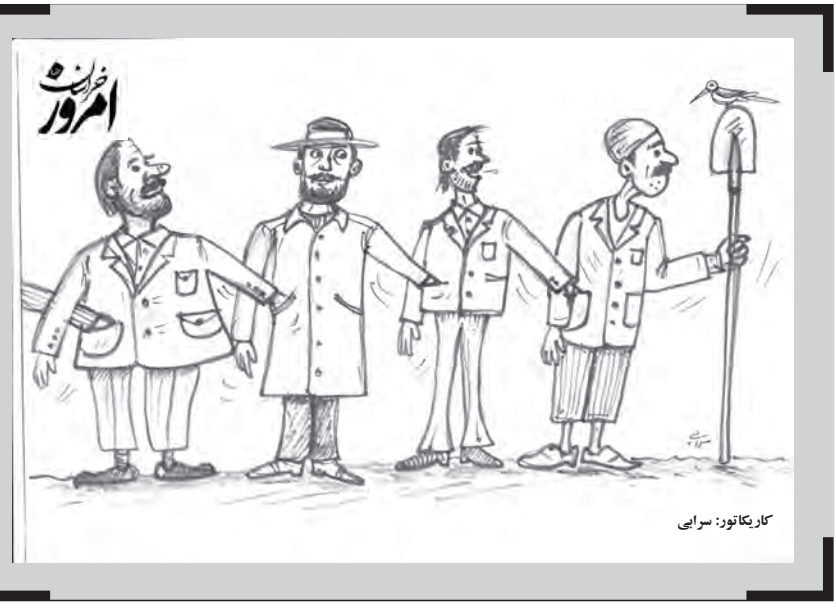
کار: کاتوز، سربای